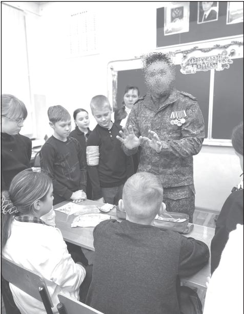
Дети с интересом слушали рассказ бойцов...