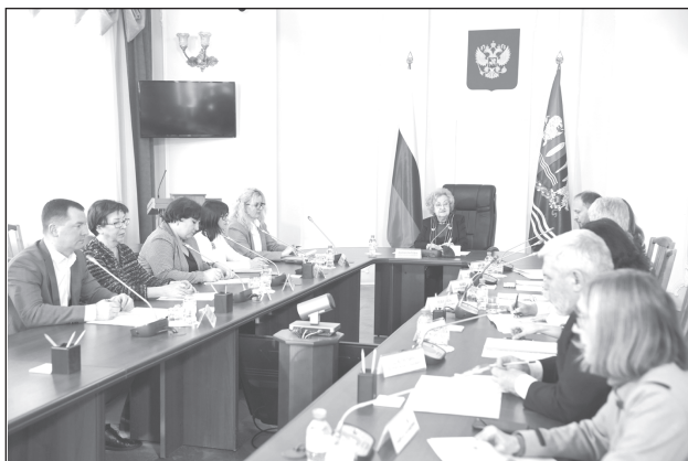
Государственное юридическое бюро - важный участник системы бесплатной юридической помощи.