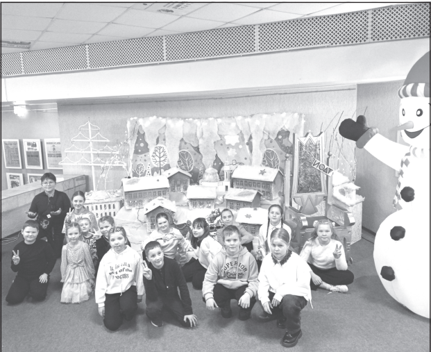
Талантливая игра актёров и красочные декорации создали новогоднюю атмосферу

Проведение новогодних представлений для семей - добрая традиция регионального отделения «ЕР». Не первый год это мероприятие собирает сотни детей и родителей, даря им возможность провести время вместе в атмосфере праздника.