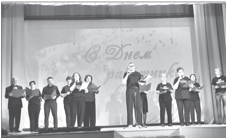
«И хорошей песней, и задорным смехом мы культуру будем прославлять», - вот девиз приволжских культработников

Как должны отметить свой профессиональный праздник работники культуры? Ответ понятен: весело, креативно, ярко, ведь честь мундира уронить нельзя! Так оно и произошло. Но для этого всему коллективу Приволжского дома культуры пришлось приложить немало сил.