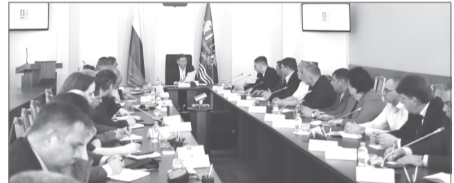
Главная задача регоператора - навести полный порядок на контейнерных площадках

В работе использованы материалы с официального сайта правительства Ивановской области. Материалы публикуются в сокращении. Полную их версию читайте на сайте газеты: www.privolzhskaya-nov.ru