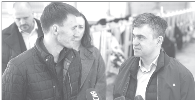
Идёт обсуждение хода инвестпроекта.