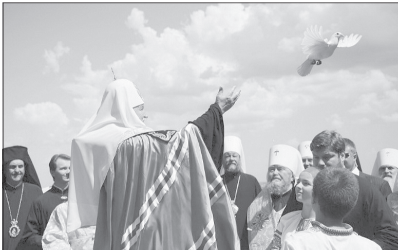
Обычай выпускать птиц на волю в праздник по-прежнему с нами.