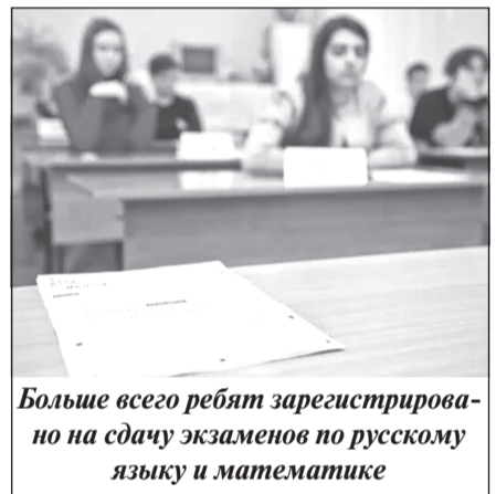
Больше всего ребят зарегистрировано на сдачу экзаменов по русскому языку и математике

Сайт отдела образования Приволжского района