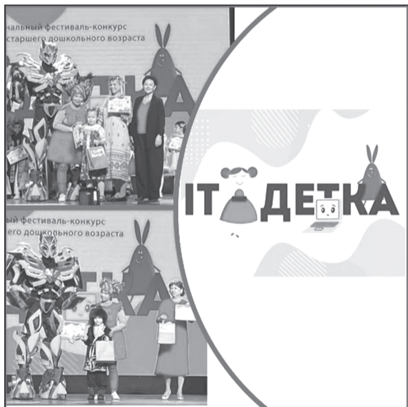
Мальши учатся уважать традиции своей страны