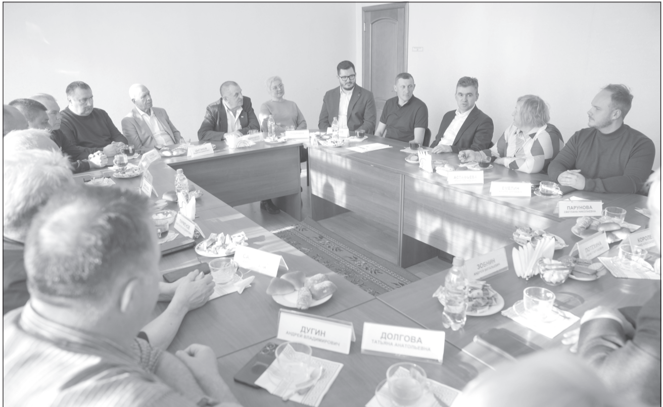
Состоялся заинтересованный разговор с первым лицом области о перспективах дальнейшего развития муниципалитета

Участники встречи обсудили популяризацию среди учеников естественных и технических наук, инженерных спе-