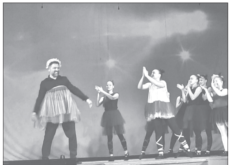
И балет нашим культработникам совсем не чужд