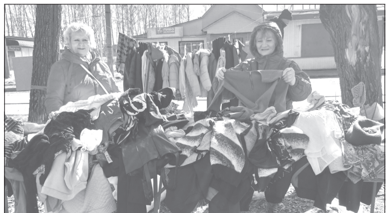
Акция «Твори добро» пользуется спросом. Присоединяйтесь, давайте помогать друг другу