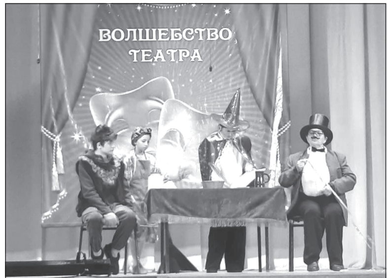
«Обыкновенное чудо». На сцене театральный коллектив «Юла»