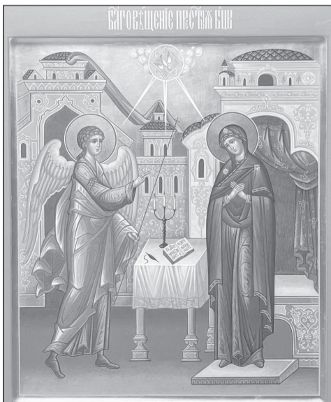
Икона: Успенский Кафедральный собор, г. Иваново

как голос певчей птицы в клетке. Сегодня мы предпочитаем птичьему пению современную технику, но обычай выпускать на волю птиц в праздник Благовещения по-прежнему с нами.