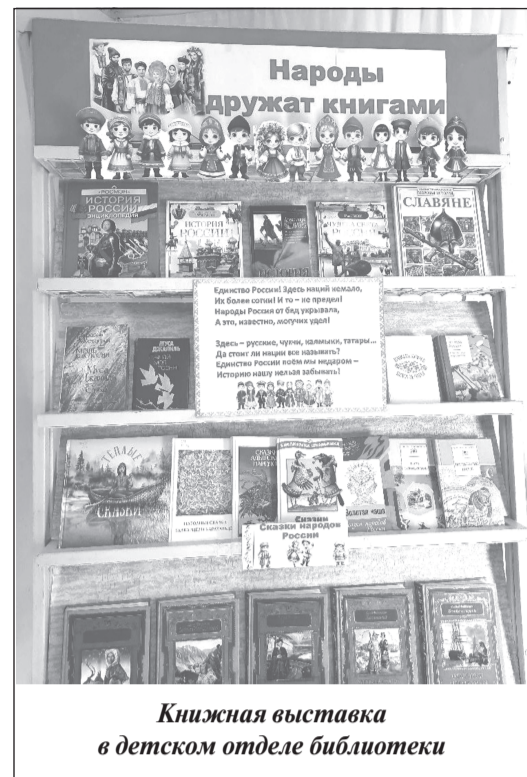
Книжная выставка в детском отделе библиотеки

- Дети должны учиться любить книги с детства. Если этого не произойдёт, потом уже заставить полюбить чтение будет очень трудно. К сожалению, сейчас родители покупают своим детям мало книг, это заметно. Об этом я знаю и от своих воспитанников, такой вывод делаю и из собственных наблюдений. Дети стали редко приносить в группу книги из дома. Но всё же это бывает! И я обязательно пользуюсь этим случаем, чтобы книгу ребёнку всем показать, её прочитать и похвалить малыша и его родителей за то, что в их доме есть детские книги (чаще всего дети приносят энциклопедии, книги, связанные с их