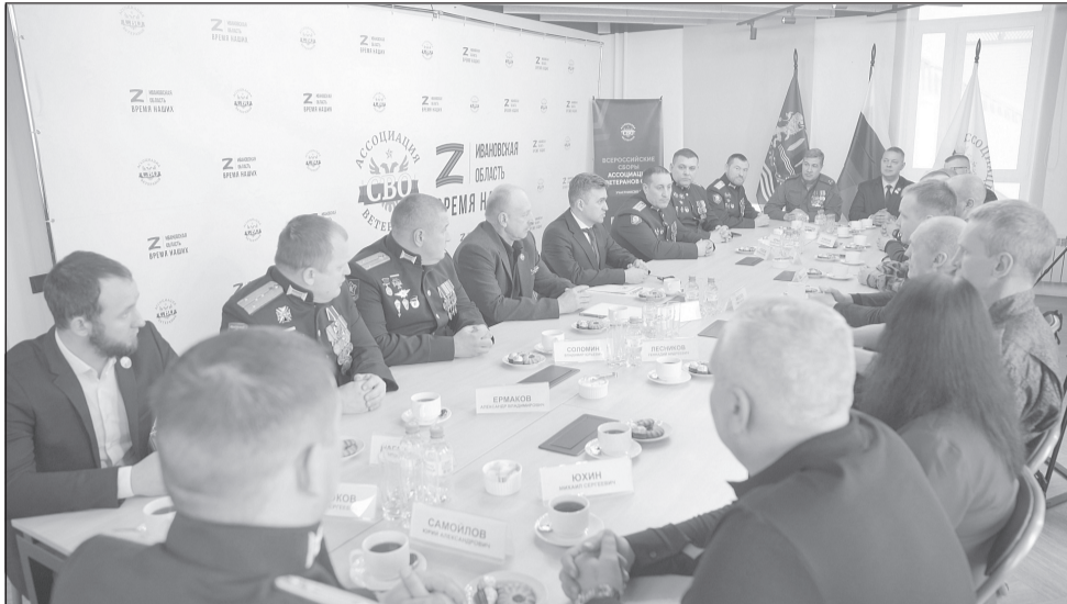
Участникам СВО необходимы дополнительные гарантии при трудоустройстве.

В Ивановской области принят закон о квотировании рабочих мест для участников СВО на предприятиях и в органах власти регионального и муниципального уровня.