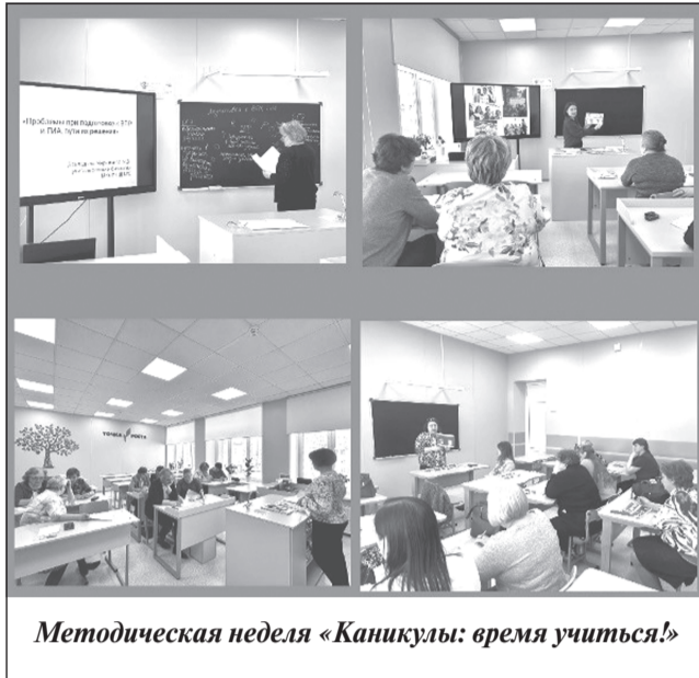
Методическая неделя «Каникулы: время учиться!»

Кроме того, педагоги общеобразовательных организаций района приняли участие в VIII региональной методической неделе «Каникулы: время учиться!» (организатор - Университет непрерывного образования и инноваций), а директора