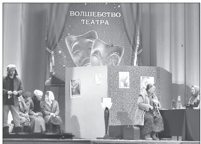
Актеры театральной студии «Шкатулка» представляют отрывок из пьесы Шварца «Одна ночь»