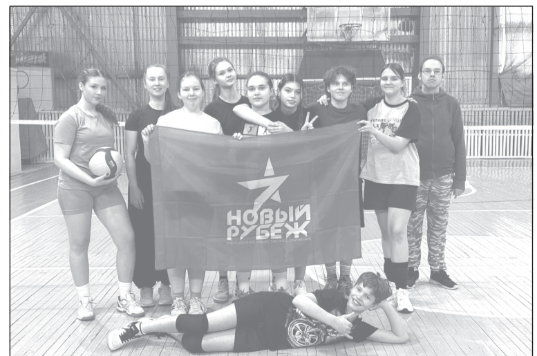
Держим равнение на команду новорубежцев

Активисты молодёжного патриотического движения «Новый рубеж» организовали товарищескую встречу по волейболу в ФОКе, которая стала для ее участников отличной возможностью проявить таланты, поддержать командный дух и просто весело провести время.