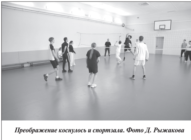
Преображение коснулось и спортзала.

Станислав Воскресенский отметил современный подход к обустройству внутренних пространств