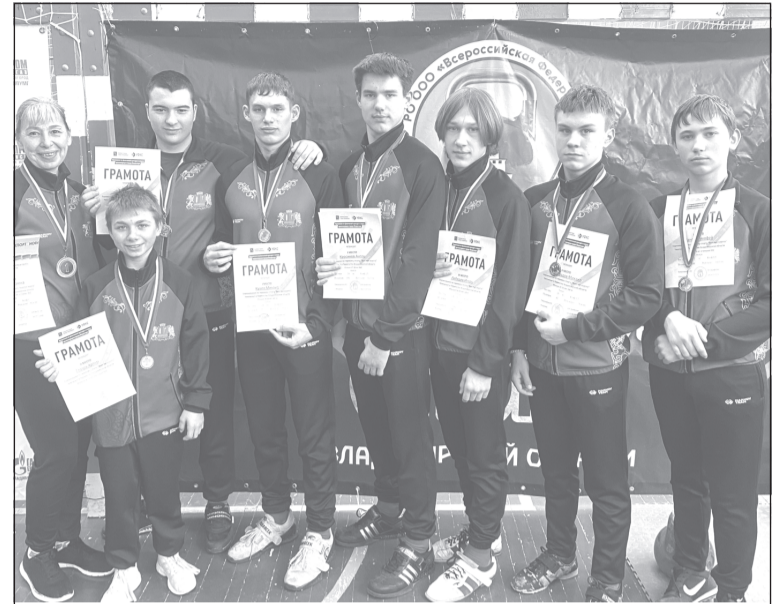
Гиревики - гордость нашего района

Во Владимире прошли Чемпионат и Первенство Владимирской области по гиревому спорту, дисциплины - толчок и рывок.