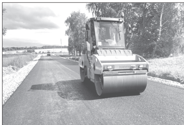
На ремонт сельских дорог будет израсходовано не менее 10% дорожного фонда