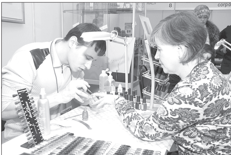
Риск подхватить опасный вирус присутствует во время посещения стоматолога, маникюрного салона или парикмахерской.

Беседовала Ольга ПЕТРОВА, «Ивановская газета»