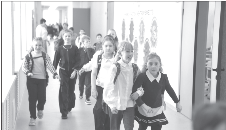
Обновлению ребята очень рады и с удовольствием ходят в школу.