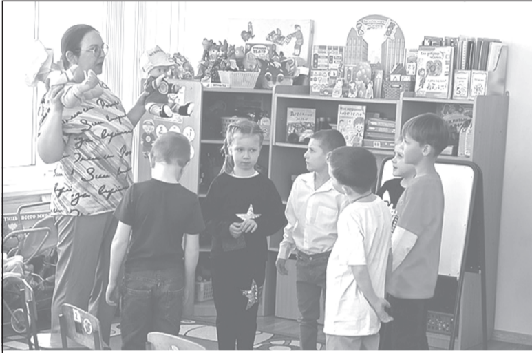
Обучающие куклы помогают формировать здоровый образ жизни у малышей

На базе д/с №10 «Солнышко» прошел межмуниципальный семинар по формированию навыков здорового образа жизни у детей дошкольного возраста «Полезные привычки: здоровье с валеокуклами».