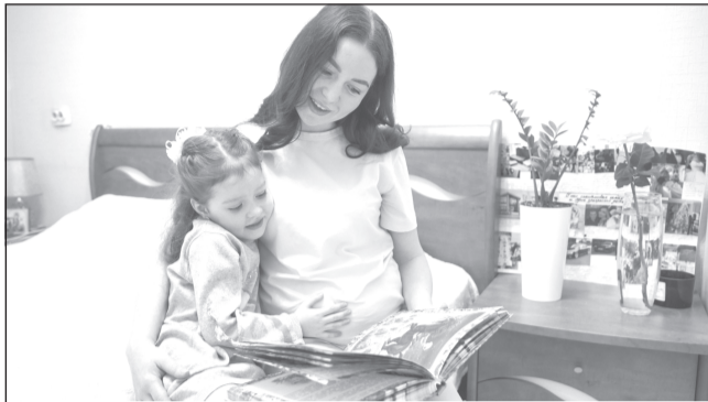
Расширен перечень получателей региональной поддержки.

Напомним, в Ивановской области молодые родители с маленькими детьми до 3 лет могут получить компенсацию оплаты найма жилого помещения: 50% - при рождении первого ребёнка, 75% - второго и последующего. Однако ранее действовало строгое условие: в населенном пункте, где семья арендует жилье, у нее не должно