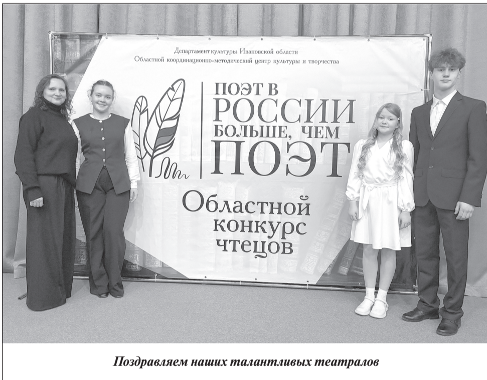
Поздравляем наших талантливых театралов

Поздравляем наших талантливых театралов и желаем им новых творческих побед!