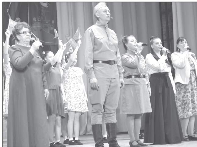
Для единства возраст не важен