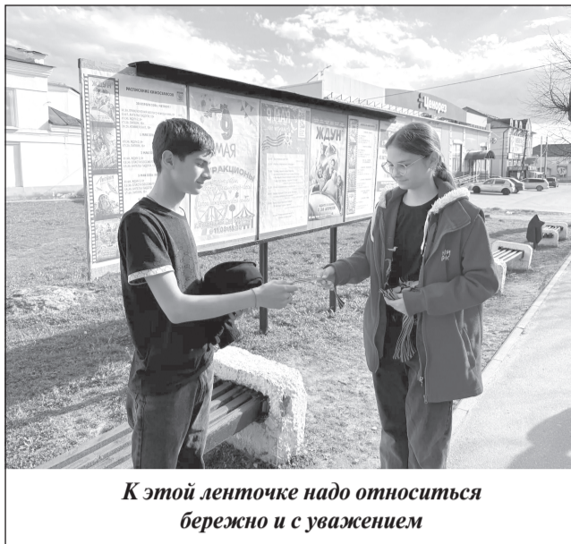
К этой ленточке надо относиться бережно и с уважением

Активисты молодёжного движения «Новый Рубеж» провели Всероссийскую акцию «Георгиевская ленточка». Ребята вручали приволжанам символ, олицетворяющий память о героических подвигах русских солдат в Великой Отечествен-