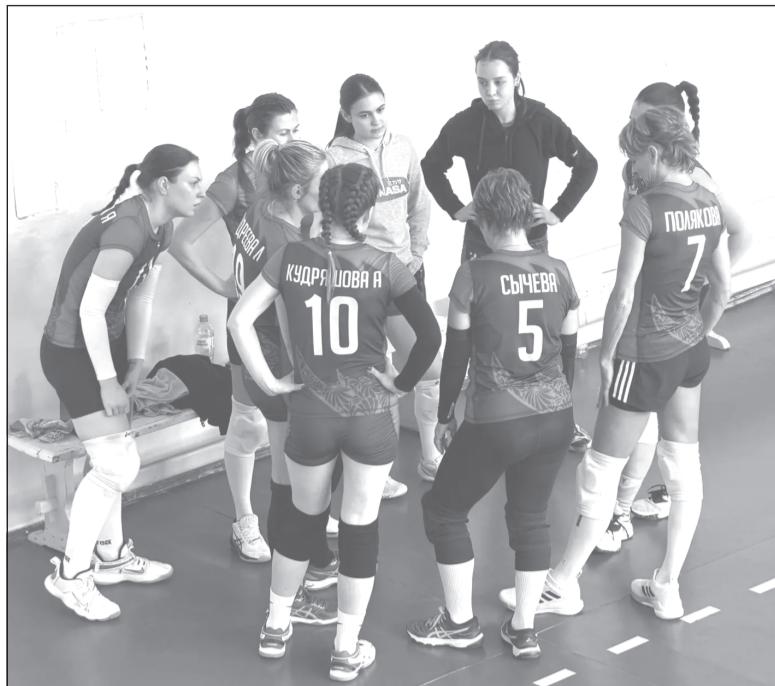
Настрой только на победу!

Себя со стороны видим, как перспективную команду, способную расти и совершенствоваться. Для этого нам нужны выезды, участие в разных соревнованиях. И если главный чемпионат у нас в области один, то есть другие возможности - участвовать в турнирах в других городах, к примеру, нас приглашают Нерехта, Южа, Кострома, Каменка, Ново-Талицы... Надо постараться в следующем спортивном сезоне совершать такие поездки чаще. Ну и главная наша задача - выиграть чемпионат Ивановской области. Это реально. Верим в свои силы! Хотелось бы, чтобы и город гордился нами.