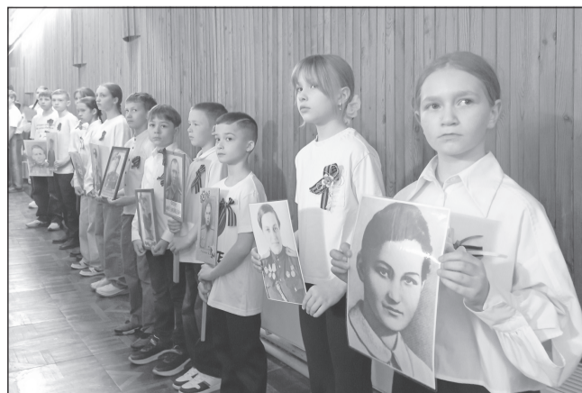
Бессмертный полк в строю навечно