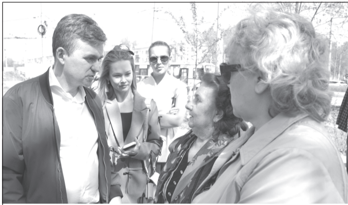
Все проекты преобразования областного центра губернатор обсуждает с жителями.

Максим Комиссаров доложил, какова ситуация со знаковыми стройками.