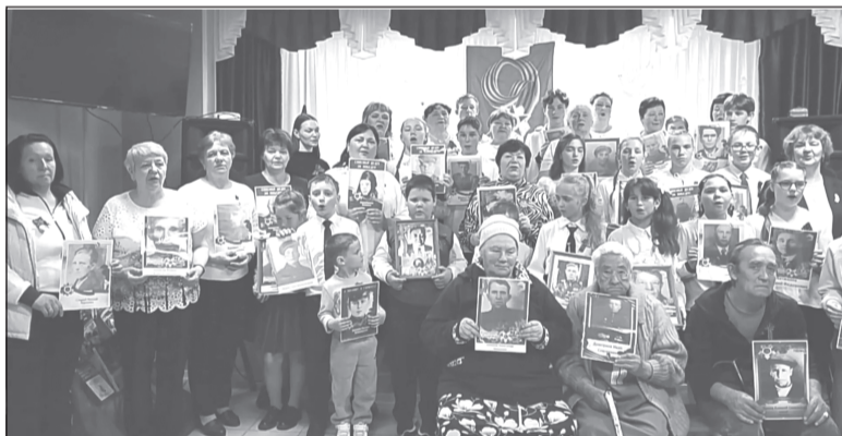
Фестиваль «Салют, Победа!» - это живая связь поколений

«Сегодня особенно важно, чтобы наши дети и внуки знали правду о Великой Отечественной вой-