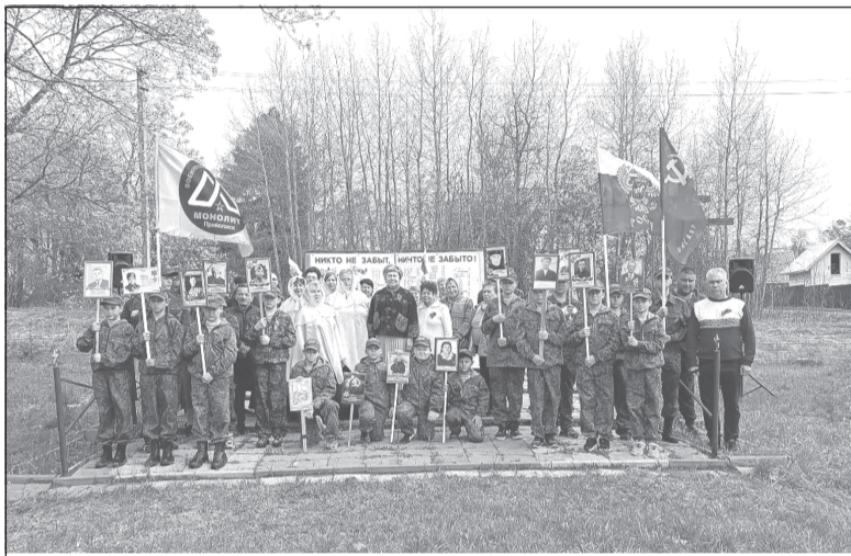
Минутой молчания собравшиеся почтили память павших

8 мая в Красинском прошла торжественная концертная программа, посвящённая 81-й годовщине со Дня Победы в Великой Отечественной войне. Она напомнила нам о подвиге наших дедов и прадедов, подаривших своим потомкам мирное небо над головой.