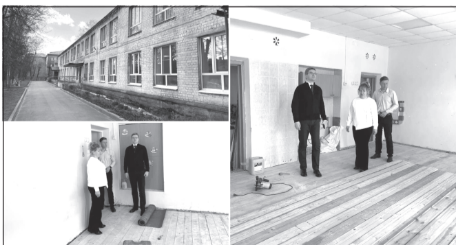
Особое внимание - строгому соблюдению сроков завершения ремонтных работ

«Проведение капитального ремонта детских садов и школ - это не только обновление зданий, но и создание безопасных, современных и комфортных условий для наших детей. Мы понимаем, что от качества образовательной среды напрямую зависит развитие и благополучие каж-