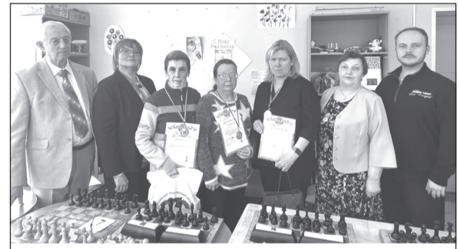
Борьба и у мужчин, и у женщин была необычайно острой

Гости пришли к нам не с пустыми руками. Подарков хватило и призерам, и ветеранам, за что участники сказали организаторам на закрытии турнира большое