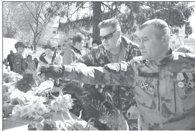
Новое поколение ветеранов чтит память своих предшественников

Память о наших предках, их мужестве и самоотверженности навсегда останется в наших сердцах. Мы помним. Гордимся. Вечная слава героям!