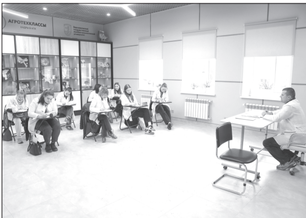
Обсуждение развития аграрной науки и подготовки кадров.

«Важно, что в этот центр могут люди обратиться, у которых есть домашние животные, но самая важная задача - все-таки наука и обучение. Здорово, что такой центр появился, со слов главврача, который переехал к нам из Москвы, это сейчас один из лучших университетских центров в центральной России», - подчеркнул Станислав Воскресенский.