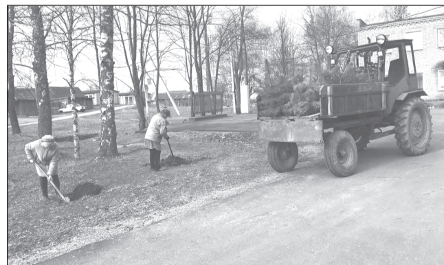
Молодые саженцы будут напоминать селянам о павших героях

В с. Горки-Чириковы депутаты Новского сельского поселения, сотрудники администрации, дома культуры, библиотеки и неравнодушные жители села присоединились к международной патриотической акции «Сад памяти».