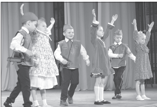
История прадедов - наша история