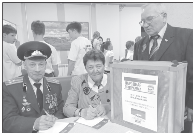
Все желающие внесли свои предложения в «Народную программу» «ЕР»