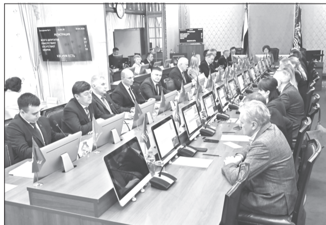
Участники СВО включены в число получателей государственной социальной помощи