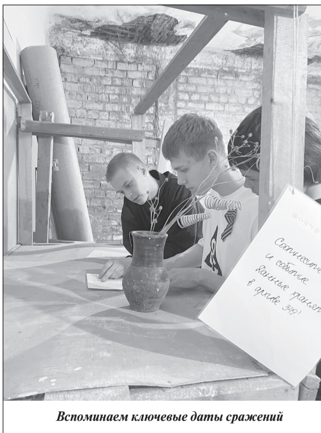
Вспоминаем ключевые даты сражений

Каждый элемент декора - не просто украшение, а символ памяти. Теперь эти окна рассказывают историю мужества и героизма, напоминая каждому проходящему о цене Победы.