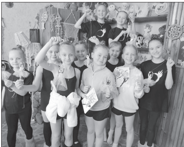
Всестороннее развитие участников коллектива - залог будущих успехов

29 апреля отмечался Международный день танца - праздник, посвящённый всем направлениям хореографии.