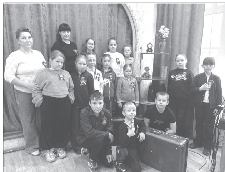
Ребята погрузились в историю военного времени