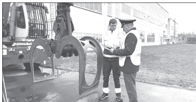
Проверка готовности сельхозтехники

В преддверии посевной инспекторы Госгостехнадзора проверяют готовность сельхозтехники. По оценкам специалистов, готовность сельхозтехники у аграриев сейчас составляет более 92%, что позволит при наступлении благоприятных погодных условий вовремя приступить к посевной кампании.