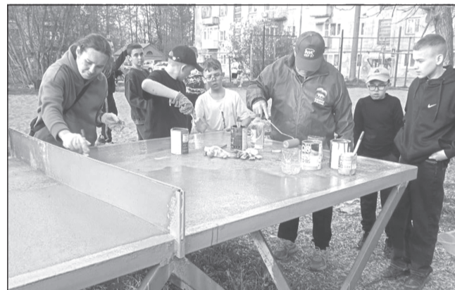
Старшие обучают младших навыкам покраски деревянных поверхностей