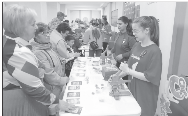
Волонтеры ЦДЮТ провели викторину о пионерах-героях и событиях Великой Отечественной войны