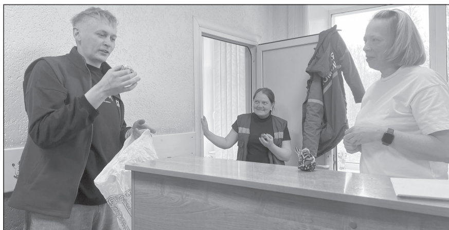
Пусть обереги хранят медиков и дарят хорошее настроение

Пусть обереги хранят их и дарят хорошее настроение.