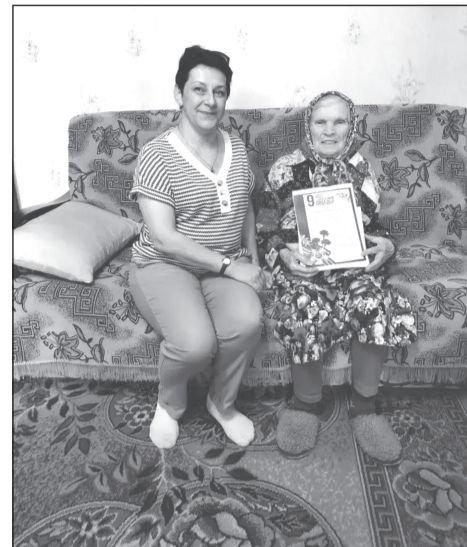
День уважения детям войны и труженникам тыла

В преддверии 81-й годовщины Победы в Великой Отечественной войне депутаты Совета Приволжского городского поселения поздравили труженников тыла.