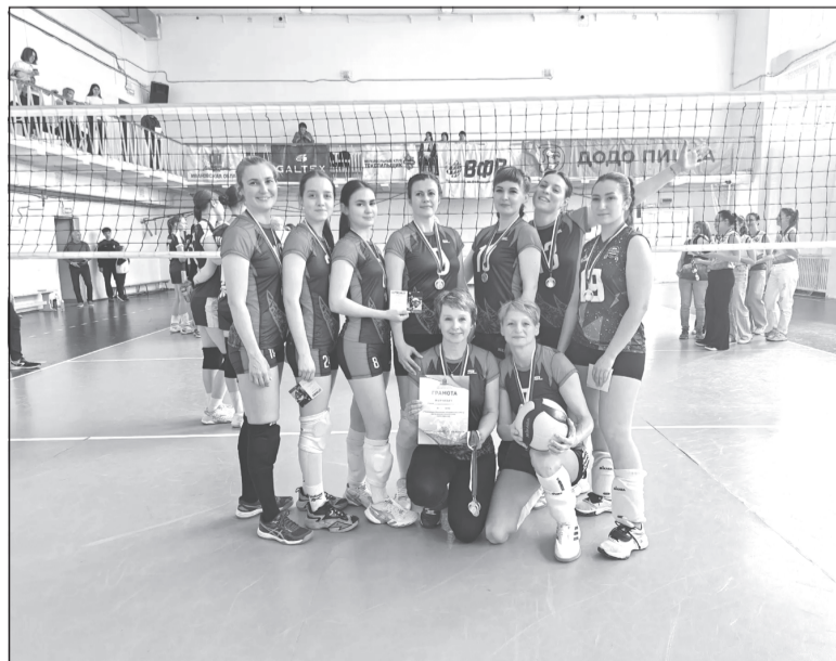
«Приволжаночке» вручена грамота за 2-е место в чемпионате Ивановской области