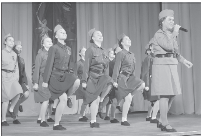
Песня и танец помогли выстоять и сохранить веру в Победу