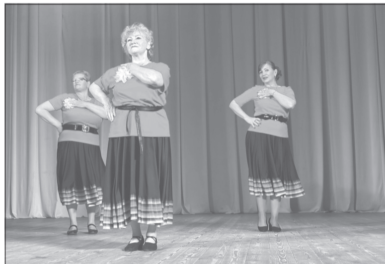
Элегантные исполнительницы из коллектива «Креатив»

Как и обычно, участники концерта представили своё творчество в трёх видах: чтение стихов, исполнение песен и театральные постановки. И если кто-то поду-