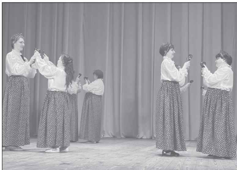
Танец с ложками в исполнении любительского объединения «Крылья»

перед зрителями исполнительницы из вокального ансамбля «Раздолье» из ЦСО. И пели они про «самую малость, нужную для счастья» - яркое солнце, которое зажигается в сердцах. Не менее зрелищными были и танцы. Тут преуспели коллектив «Креатив» из ЦСО и «Крылья». Красивые костюмы, прекрасное настроение ис-