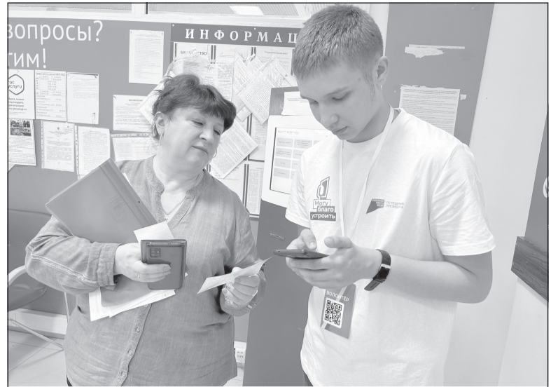
После выбора объекта волонтер фиксирует голос в приложении

Для участия в голосовании через волонтера жителям необходимо пройти идентификацию одним из двух способов: через сканирование QR-кода своим смартфоном для входа в «Госуслуги» либо по номеру мобильного телефона с подтверждением через СМС-код. После выбора объекта волонтер фиксирует голос в приложении, гражданин подтверждает решение, и система