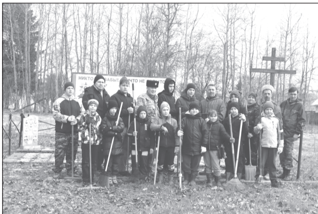
Благоустройство воинских захоронений - это не акция, это наш долг

Всероссийский субботник по благоустройству памятных мест и воинских захоронений прошёл в селе Красинское.