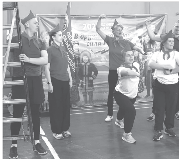
Будь готов! Всегда готов!