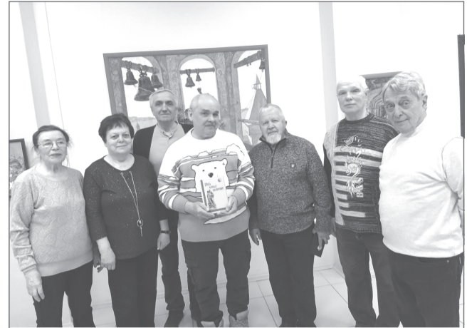
Открытие выставки привлекает ценителей живописи и истории