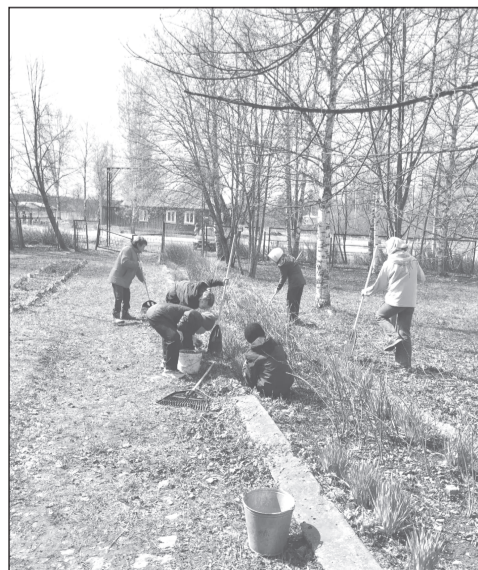
Уборка на «Аллее Победы»

В Приволжском районе проходит традиционный экологический субботник, в котором активное участие принимают школьники. Ребята из всех школ вышли на закрепленные за учебными заведениями территории, чтобы навести порядок после зимнего периода.