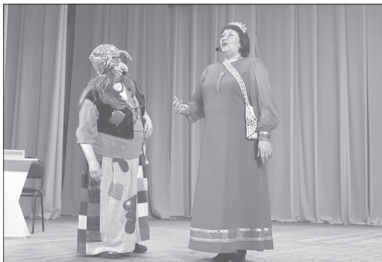
Как Бабе Яге выйти на пенсию? Это знает только Василиса Премудрая