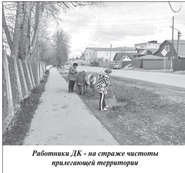
Работники ДК - на страже чистоты прилегающей территории