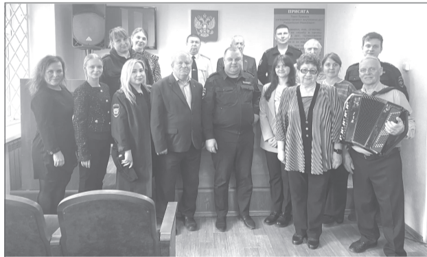
Мудрость старшего поколения и инициатива молодежи - основа успешной работы ОМВД

Свой профессиональный праздник отметили ветераны органов внутренних дел и внутренних войск МВД России.