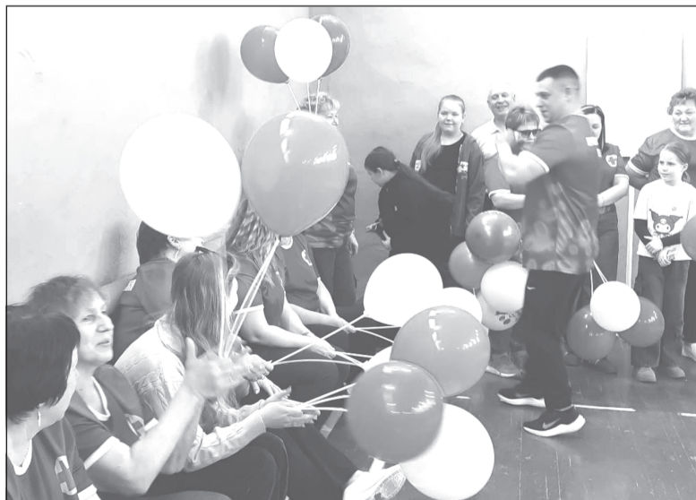
Группа поддержки ЦРБ вместе со своей командой. Они - одной крови!