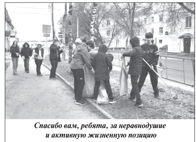
Спасибо вам, ребята, за неравнодушие и активную жизненную позицию

Под руководством педагогов учащиеся школы №1 г. Приволжска провели уборку на «Аллее Победы» - значимом общественном пространстве, где в этом году запланировано комплексное благоустройство в рамках национального проекта «Инфраструктура для жизни».