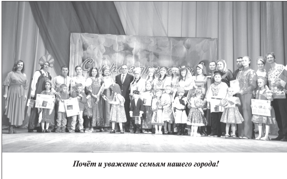
Почёт и уважение семьям нашего города!

«Культики», ЦСО - «Первомайские героини», не жалея своих сил, постарались от души. Зрелищными оказались все задания, в каждом была своя изюминка, и всё же самыми-самыми из них был первомайский «заплыв» (это когда участники должны были, надев огромные ласты, пробежать заданную дистанцию) и красивые костюмированные выходы в начале и в конце праздника. Очень интересно смотрелись команды в фартуках, рабочих халатах, с граблями, лопатами, серпом и молотом, в красных косынках. Команда из Приволжского дома культуры предстала в пионерской форме, им для своего арт-объекта потребовалась даже стремянка! Одним словом, всё получилось по-настоящему, так, как и должно было быть в этот день.