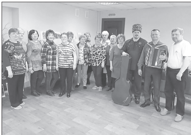
Главным инструментом этой встречи стала гитара

В рамках Года единства народов России и акции «Библиосумерки» ДК и библиотечный отдел с. Горки-Чирикеры организовали встречу в творческой гостиной «Единство в струнах: история одной судьбы».