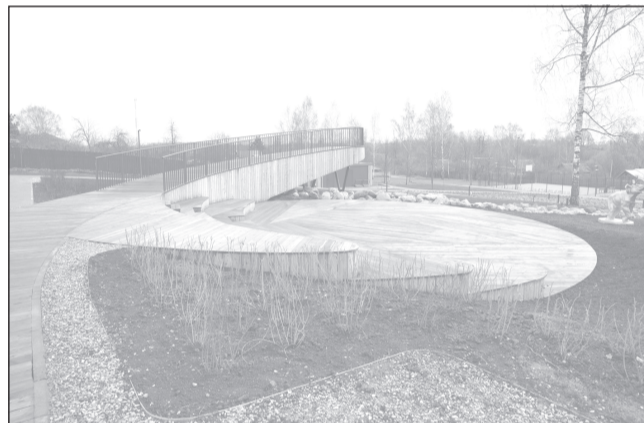
В процессе обновления Городского сада символы парка получили вторую жизнь.

ровщики нашли решение, как вписать одну из таких скульптур в новый ландшафт. Жители поблагодарили за такое внимание.