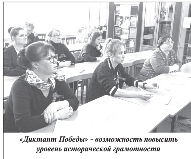
«Диктант Победы» - возможность повысить уровень исторической грамотности

ми акции на площадке библиотеки, где мероприятие проходило офлайн, стали члены и сторонники «ЕР», сотрудники библиотеки, ГДК, радио «Приволжская волна». В школах «Диктант Победы» провели в онлайн-формате. Всего нужно было ответить на 25 вопросов -