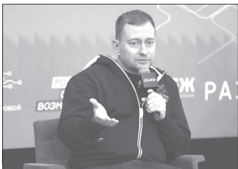
У большинства пользователей смартфонов электронная регистрация сложностей не вызывает

документов и регистрация участников предварительного голосования, которые готовы бороться за право стать кандидатом от партии. В настоящее время зарегистрированы 27 кандидатов и около 30 тысяч избирателей.