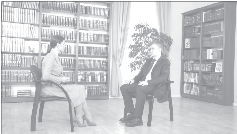
Надо заниматься экономикой, зарплатами, поддержкой промышленности, убеждён губернатор.