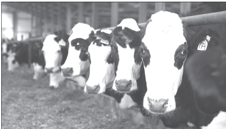
В регионе сформирована племенная база по 5 породам коров.

В рамках регионального проекта «Развитие отраслей и техническая модернизация агропромышленного комплекса» госпрограммы «Развитие сельского хозяйства и регулирование рынков сельскохозяйственной продукции, сырья и продовольствия Ивановской области» племенным хозяйствам по разведению крупного рогатого скота молочного направления направят субсидии на возмещение части затрат на содержание племенного маточного поголовья.