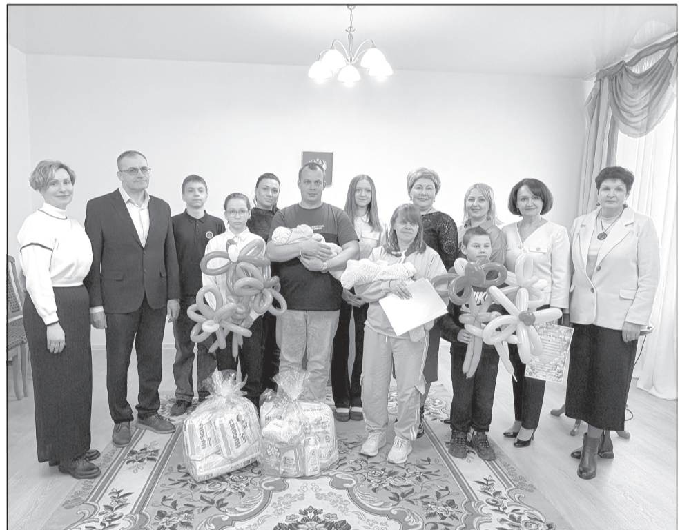
Пусть дети растут здоровыми и счастливыми!

В ЗАГСе г. Приволжска состоялось трогательное и радостное событие - вручение свидетельств о рождении двум новым жителям нашего района!