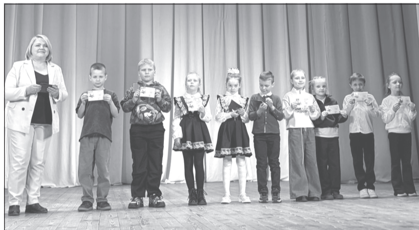
Получение знака отличия комплекса ГТО - большое событие в жизни детей