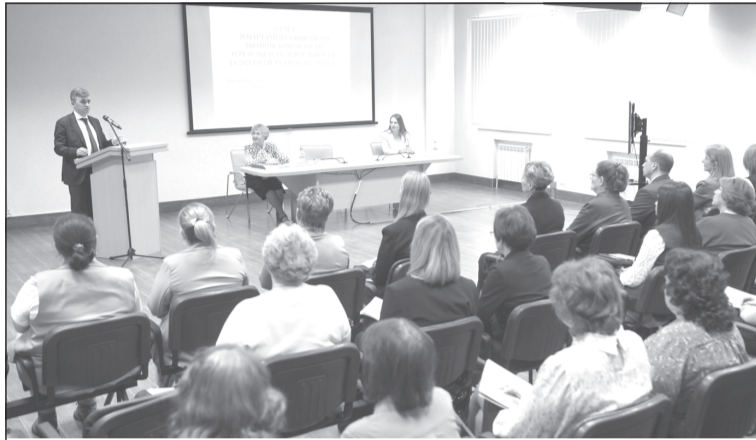
Благодаря грамотной политике налоговых льгот получилось «вырастить» целый ряд отраслей.

Приоритеты в финансовой и бюджетной сфере на 2026 год обозначил губернатор Станислав Воскресенский на коллегии профильного ведомства. Основными задачами в текущем году станут выверенная, консервативная бюджетная политика, наращивание собственных доходов облбюджета и финансовое обеспечение намеченных инфраструктурных проектов.