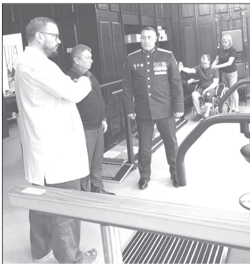
Для реабилитации бойцов применяется самое современное оборудование