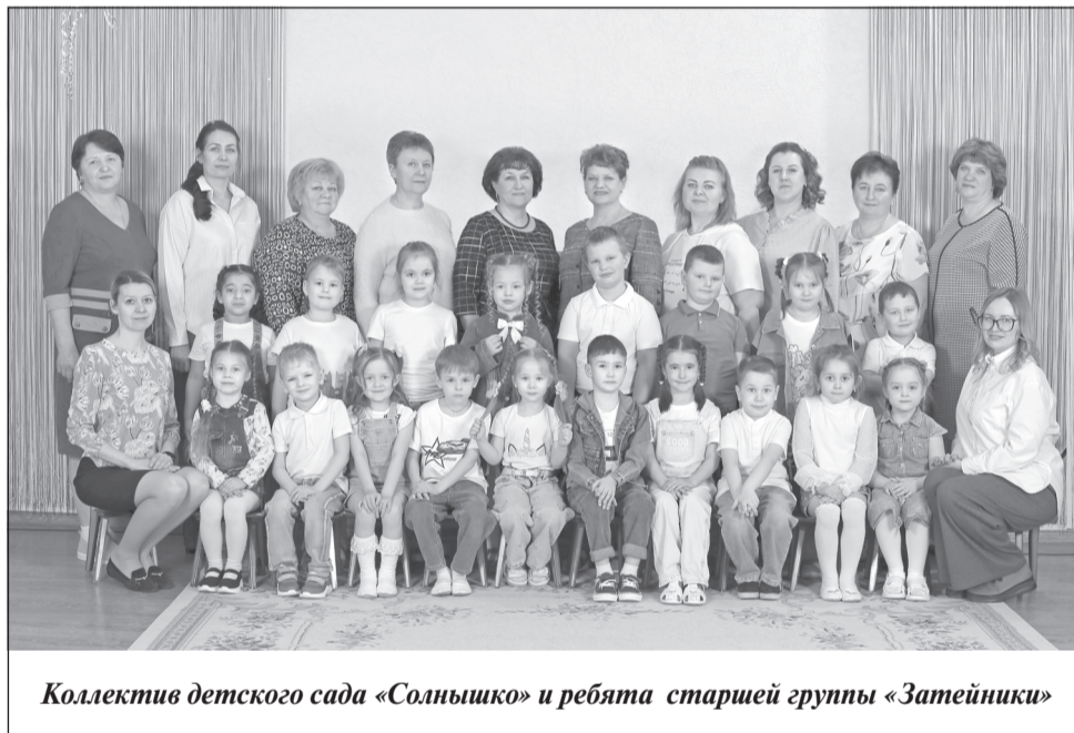
Коллектив детского сада «Солнышко» и ребята старшей группы «Затейники»

Со временем учреждение приобрело индивидуальность, значительно улучшило качество работы, материально-техническую базу. Сейчас в нашем детском саду созданы прекрасные условия для детей: имеются музыкальный, физкультурный, тренажерный залы, бассейн, современная физкультурная площадка на участке детского сада, фитобар, комната психологической разгрузки, комнаты - искусство, природы, русского быта, театрализованная студия. В последние годы наметилась тенденция к дальнейшим улучшениям. По инициативе и с поддержкой администрации района в рамках областной программы капремонта образовательных учреждений произведен капитальный ремонт крыши здания, наружных сетей канализации, горячего водоснабжения и отопления, замена всех деревянных окон на окна ПВХ, установлен новый металлический забор, произведено благоустройство территории с асфальтированием дорог и тротуаров. Такая поддержка радует и вселяет надежду, что наш детский сад будет становиться красивее и современнее с каждым годом. Но уже сегодня это стабильное, успешное и развивающееся в соответ-