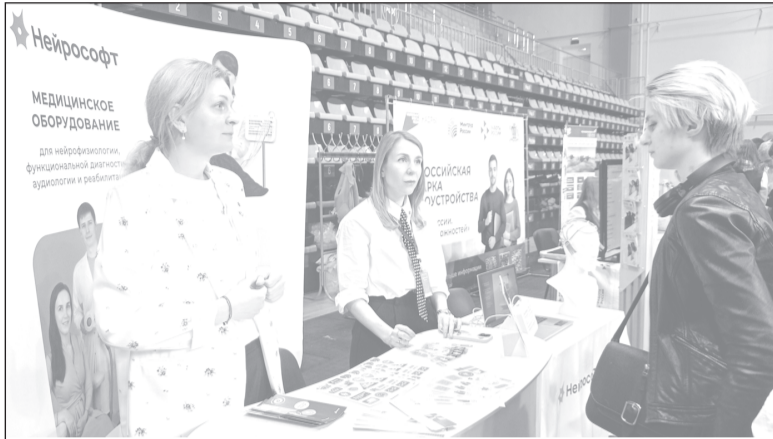
Для участников Единого дня карьеры представлено свыше 1,7 тыс. вакансий

Ежегодная ярмарка вакансий Единый день карьеры «Работай в Иванове» состоялась во Дворце игровых видов спорта. Ярмарку посетили выпускники вузов и колледжей, школьники - всего около 4,5 тысячи человек.