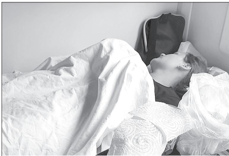
Храп в поезде может нарушить сон целого вагона.