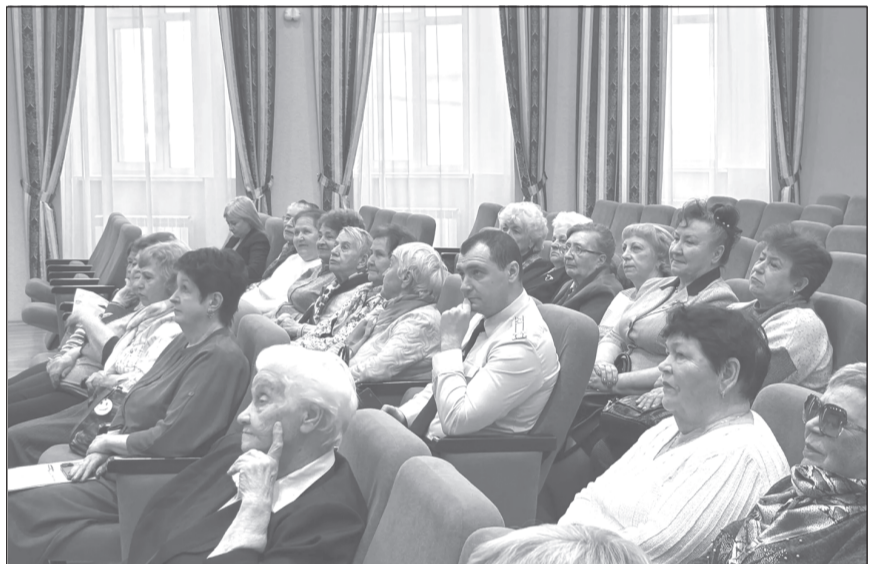
Ветераны - самая заинтересованная аудитория

пающий обратил внимание на мошенничество, продолжающее оставаться одним из самых распространённых видов преступлений. Примеры, приведённые Андреем Павловичем, говорили о том, что гражданам пожилого возраста по-прежнему являются самой уязвимой категорией населения, подвержен-