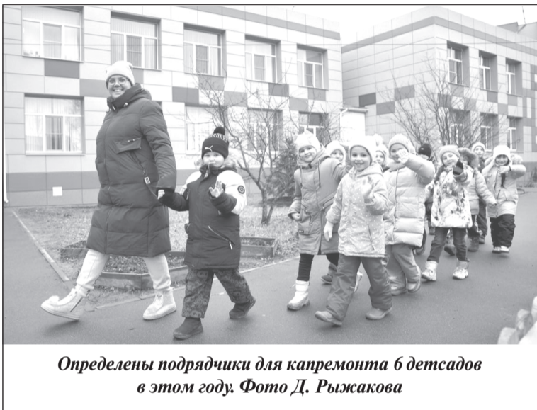
Определены подрядчики для капремонта 6 детсадов в этом году.

тор департамента строительства и архитектуры региона Ирина Костромская, завершение конкурсных процедур по всем объектам является важным этапом, позволяющим обеспечить соблюдение сроков реализации программ.