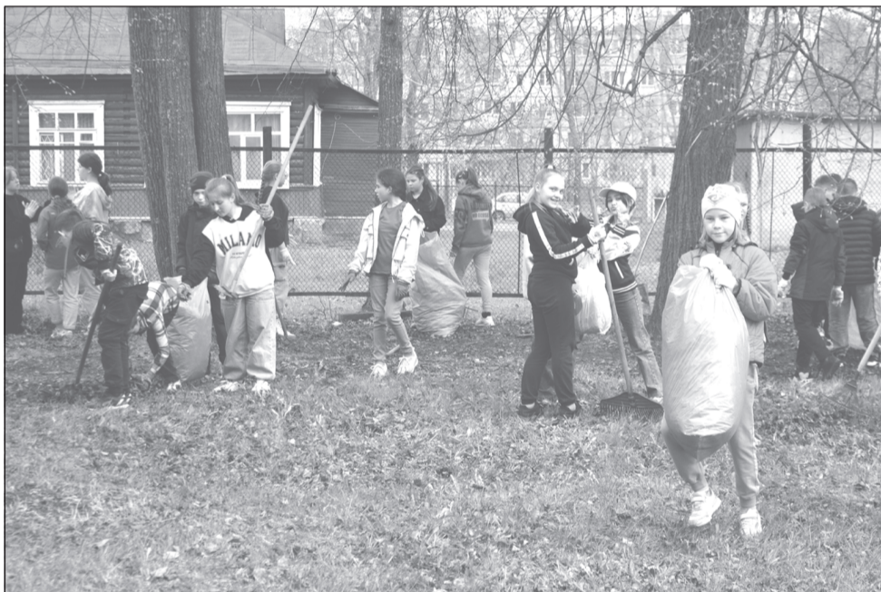
Дружно, быстро и чисто! (школа №6).