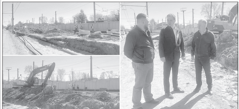
Идет инспектирование хода работ по реконструкции дорожной сети на ул. Лежневской

Контракт на реконструкцию 3-го этапа ул. Лежневской в районе кольцевой развязки заключен в сентябре 2025 г. в рамках нацпроекта «Инфраструктура для жизни». Протяженность участка, который предстоит реконструировать - 955 м. В состав работ включен участок кольцевого движения и подъезды к нему со стороны ул. Станкостроителей, Лежневской и проспекта Строителей.