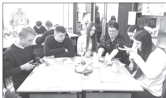
На мастер-классе ребята смастерили кукол в костюмах народов России

На скорую руку сшили фартики и перешли к кулинарным конкурсам. В первом - «Вкус единства - национальные рецепты России» - собрали изображения продуктов для приготовления выбранных национальных блюд и «приготовили» блины с медом, пельмени и борщ. Во втором, под названием «Фруктовый карвинг», максимально проявив творческие способности, смастерили из мандаринов, бананов, яблок и груш ежиков, крабов, дельфинов, мышат и фантастических животных. А потом угостились сами и накормили организаторов встречи.