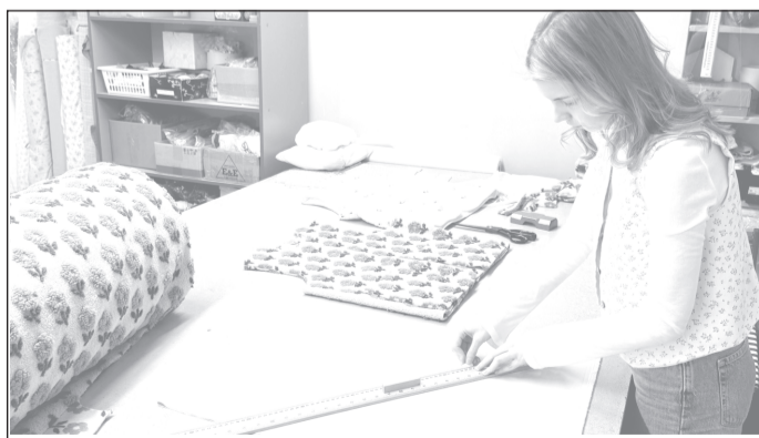
В целях лучшей адаптации к новым налоговым условиям продлили все налоговые льготы