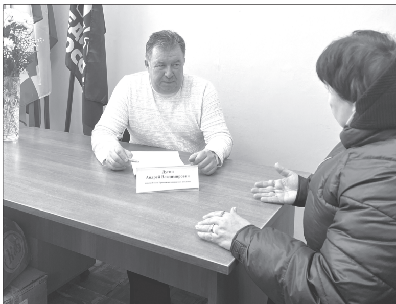
Работа депутатов - это решение проблем граждан

Предварительная запись на приём: 8-49339-2-12-21, 8-909-247-68-92.