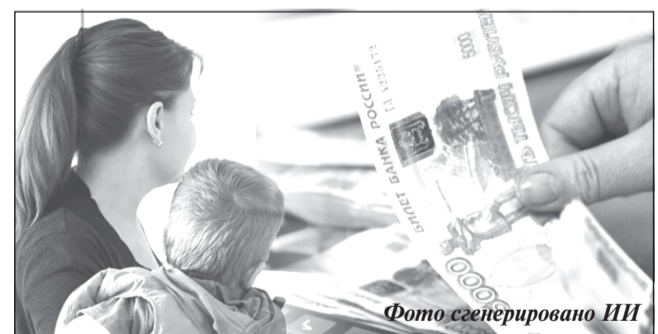
Фото сгенерировано ИИ

Размер выплаты определяется как разница между суммой расчетного исчисленного налога на доходы физических лиц с доходов заявителя, полученных в году, предшествующем году обращения за назначением выплаты, и суммой, исчисленной с того