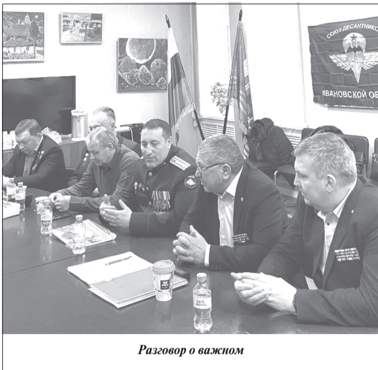
Разговор о важном

На днях прошло собрание Ивановской областной общественной организации «Союз десантников», на котором речь шла о мерах поддержки военнослужащих и членов их семей, а также о продолжении работы по патриотическому воспитанию молодежи.