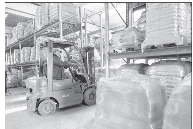
Ключевая задача - обеспечение аграриев материально-техническими ресурсами

под яровой сев. В прошлом году под урожай этого года