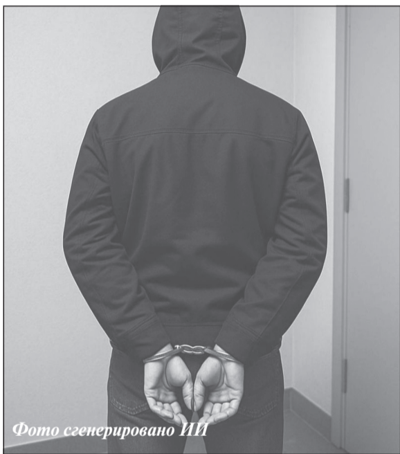
Фото сгенерировано ИИ

2-м Западным окружным военным судом вынесен обвинительный приговор жителю г. Иваново, публично призывавшему к осуществлению террористической деятельности.