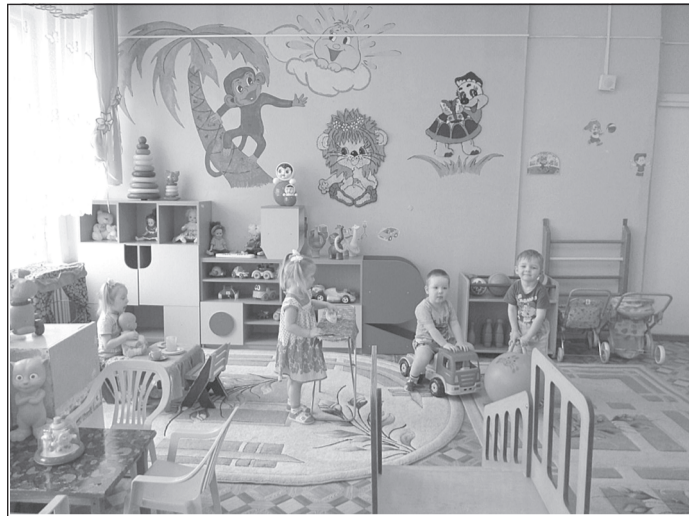
Малышам у нас весело и интересно