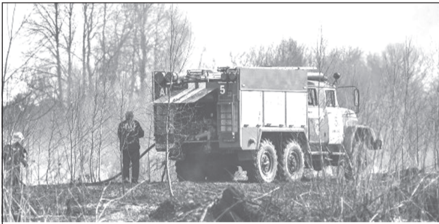
Среди первоочередных профилактических мер - создание противопожарных полос

Комиссия Департамента лесного хозяйства по Центральному федеральному округу завершила проверку работы региональных служб, задействованных в тушении лесных и других природных пожаров. По итогам надзорных мероприятий Ивановская область признана готовой к предстоящему пожароопасному сезону.