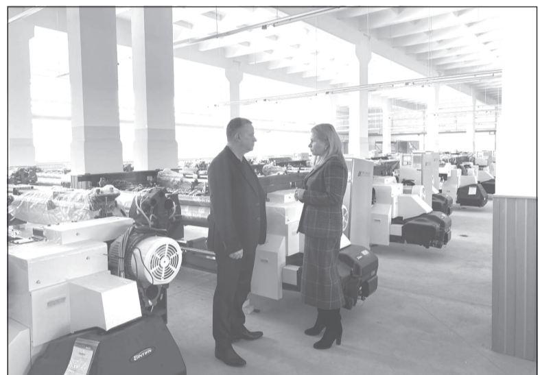
Льготное финансирование помогло при закупке нового оборудования

В 2024 году поддержку в виде льготного финансирования ФРП получили четыре предприятия машиностроения и легкой промышленности Ивановской области. В компании «Русский дом» реализуют инвестиционный проект по модернизации ткацкого производства.