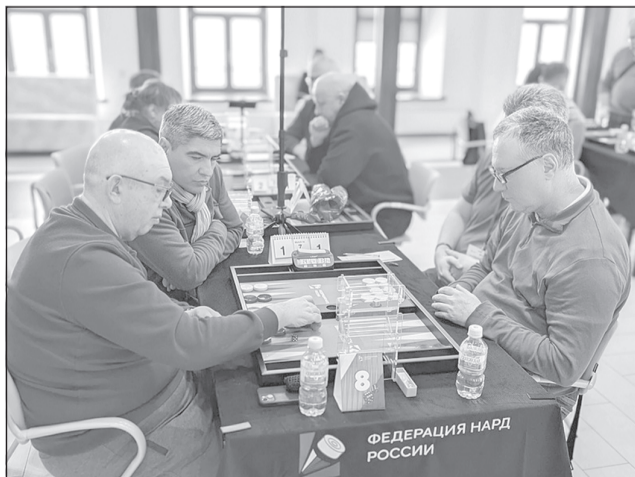
Турнир собрал в Левитан-холле свыше полсотни участников

Плётс принимал мероприятие Федерации нарды России, которое носит имя самого уважаемого мастера в истории российских нардов - К.В. Некрасова. Учёный-математик, он стал первым автором книг про нарды на русском языке, его именем названа стандартная ситуация в нардах (манёр Некрасова).