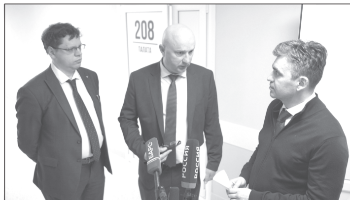
Обсуждение результатов реализации пилотного проекта по записи к врачам-специалистам.