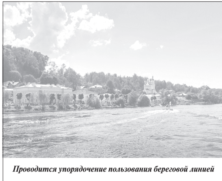
Проводится упорядочение пользования береговой линией

Также удовлетворен иск Прокуратуры Ивановской области о признании недействительным договора аренды земельного участка, расположенного в границах территории объекта культурного наследия муниципального значения «Дача Ф.И. Шаляпина» площадью 26 га и кадастровой стоимостью более 100 млн рублей. Данный участок также ранее был незаконно предоставлен указанному лицу и возвращен в казну государства по решению суда.