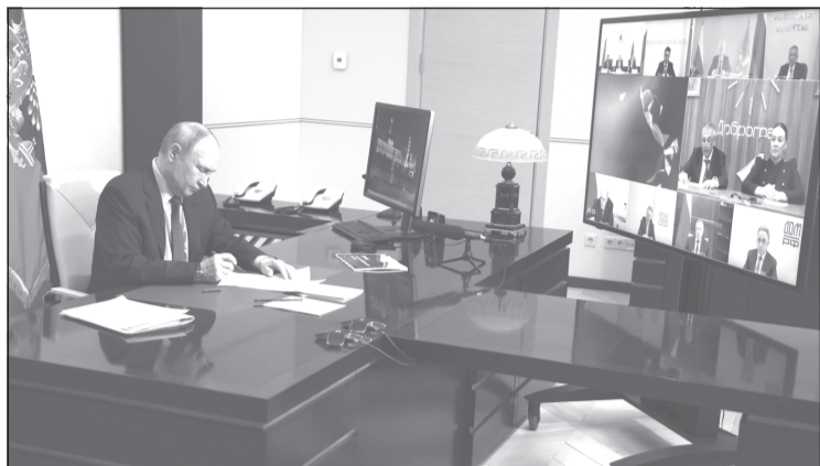
На повестке дня - реализация нового нацпроекта.

Президент России Владимир Путин провёл расширенное заседание Президиума Государственного Совета РФ, посвящённое вопросам развития инфраструктуры для жизни. Участие в нём вместе с представителями федеральных ведомств, главами регионов принял губернатор Ивановской области Станислав Воскресенский.