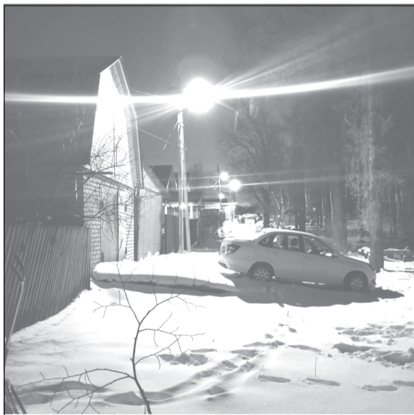
Наша задача - сделать жизнь ветерана-участника СВО максимально комфортной

Благодаря его инициативе были успешно проведены необходимые работы по установке уличного освещения у дома ветерана, что позволило улучшить условия жизни семьи.