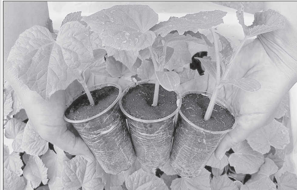
Перед высадкой рассады в открытый грунт рекомендуется ее закалить

ния болезней не рекомендуется размещать огурец после тыквенных культур (кабачки, патиссоны, тыква), столовой свеклы, фасоли, моркови. На то же место огурец можно возвращать не ранее, чем через 2-3 года.