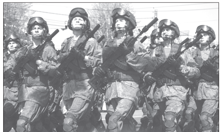
Ребята, вернувшись с СВО, должны найти достойное применение своим силам