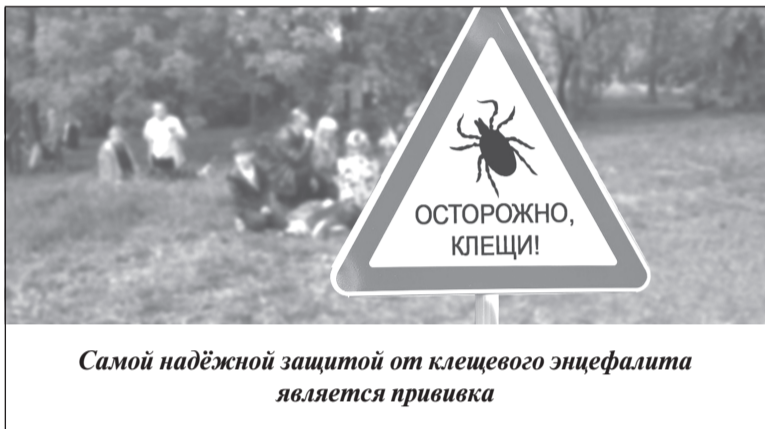
Самой надёжной защитой от клещевого энцефалита является прививка

Управление Роспотребнадзора по Ивановской области напоминает, что в регионе ежегодно регистрируются случаи заболеваемости клещевыми трансмиссивными инфекциями, к которым относятся клещевой энцефалит, иксодовый боррелиоз, а также отмечается риск заражения анаплазмозом, эрлихиозом.