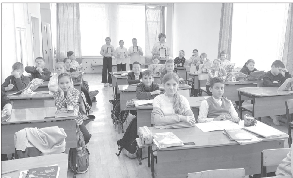
Игра началась с беседы о том, почему 12 апреля считается Днем космонавтики