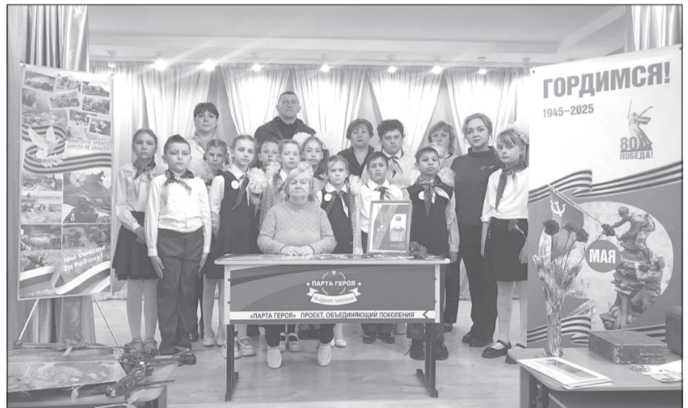
Парта героя - напоминание о мальчишках, из которых вырастают защитники Отечества

Встреча оставила в душе каждого присутствующего чувство гордости за своих земляков, а парта Героя будет напоминанием о тех простых мальчишках, из которых вырастают настоящие защитники Отечества.