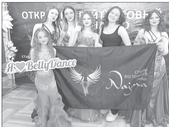
Танцовщицы из Приволжска - одни из лучших на чемпионате по восточным танцам

Юные танцовщицы из Приволжска приняли участие в чемпионате по восточным танцам.