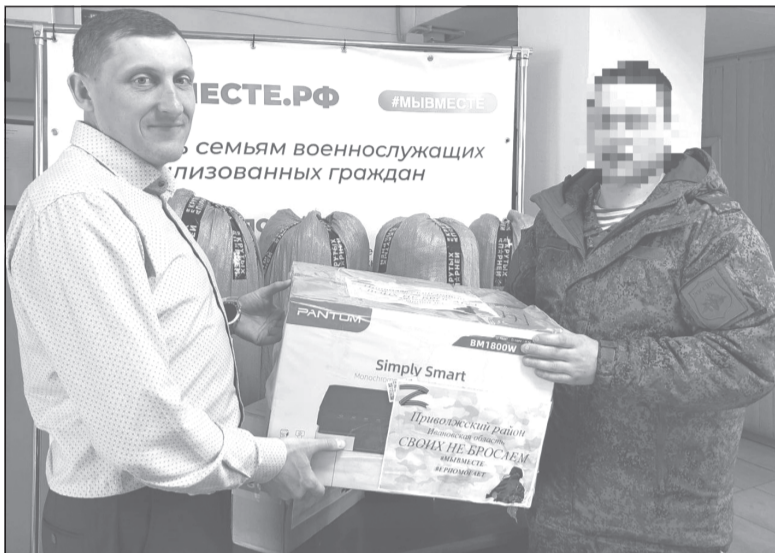
Приволжане готовы помочь землякам-участникам СВО, сколько потребуется

В условиях современных вызовов, с которыми сталкивается наша страна, важно помнить о тех, кто стоит на защите наших интересов. Недавно военнослужащий, находящийся в краткосрочном отпуске, обратился в районный штаб «Мы вместе» с просьбой об оказании гумпомощи.