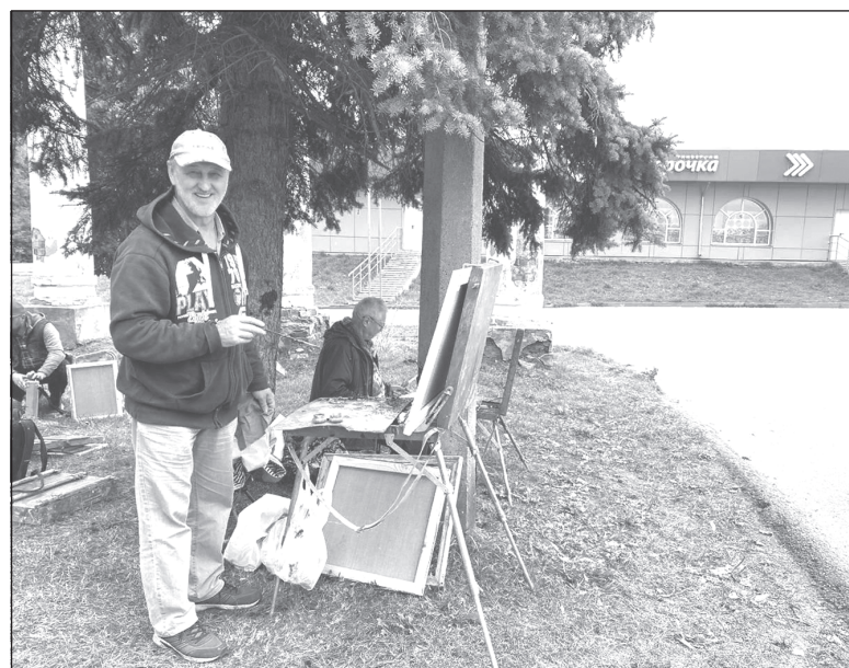
Художник за работой

- Художник чаще всего живёт новыми впечатлениями, лично мне было бы трудно почерпнуть новые идеи, сидя дома. Потому я никогда не отказывался от возможностей побывать в разных городах России, за границей. Мне повезло побывать на Валааме, в Крыму, во многих маленьких и больших городах России, я объехал нашу страну от Мурманска до Чёрного моря, а также побывал в Чехии, Сербии, Франции, Германии, Эстонии и т.д. В 2019-м увидел Швейцарию: заснеженные горы, зелень травы (поездка была в мае), человек с лыжами, шум скатившейся снежной лавины - всё произвело на меня силь-