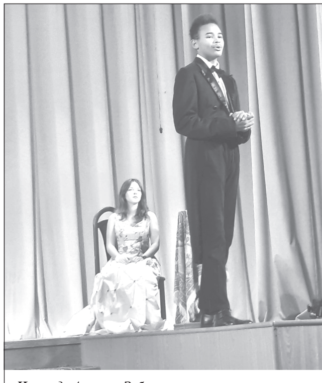
Исповедь Августа Эсборна в исполнении театралов из студии «Клубок» (г. Иваново)