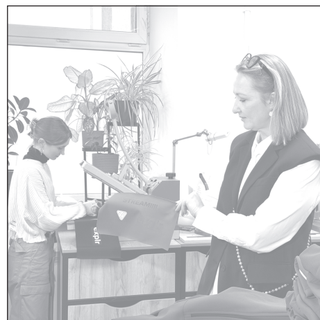
Будущие технологи познакомилась с коллекцией одежды со световозвращающими элементами