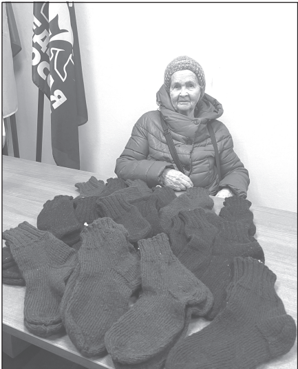
Несмотря на преклонный возраст, ветеран заботится о бойцах СВО - вяжет для них тёплые носки

Вся гуманитарная помощь, собранная благодаря таким неравнодушным людям, будет доставлена нашим военнослужащим на передовую.