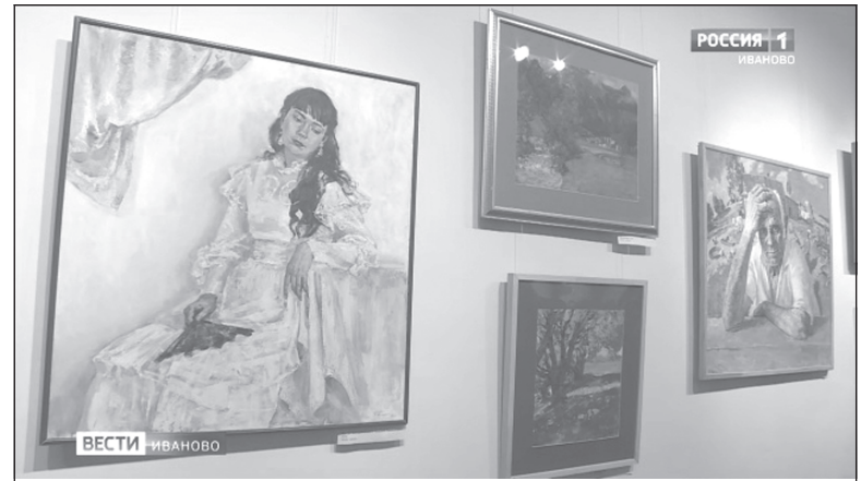
Картины художника с выставки «Траектория души»

ное впечатление... Новое состояние природы... Для художника тут речь должна идти об изменении палитры. Нельзя писать природу разных регионов одной и той же гаммой красок. Так повелось, что у художников средней полосы - одна цветовая палитра, в Крыму - другая, в Санкт-Петербурге - третья... Где-то солнце жёлтое, а где-то оно белое... Это сложно, подобрать нужные краски, но без этого невозможно.