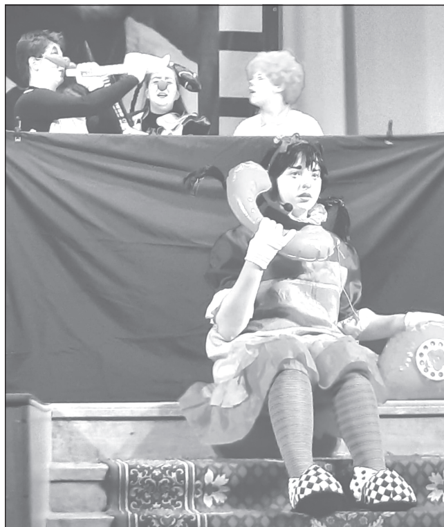
«У меня зазвонил телефон»

советского кинематографа и театрального искусства. Их вниманию были представлены фрагменты из фильмов и спектаклей, в которых играл артист: «Остров сокровищ», «Гиперболоид инженера Гарина», «Стёжки-дорожки», «Когда поют соловьи», «Киевлянка», «Дневник директора школы», «Подросток»,