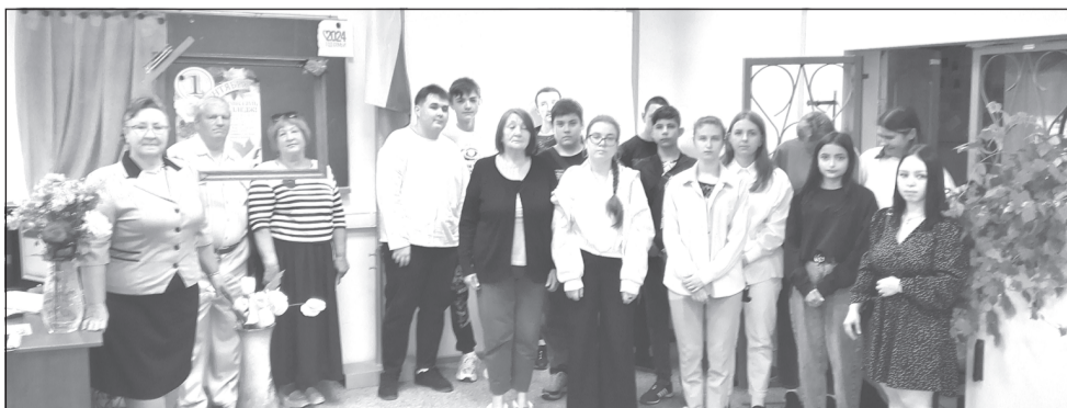
В добрый путь! Городу нужны рабочие руки