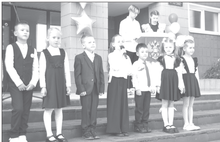
Первоклассники: бодры, веселы, абсолютно уверены в себе