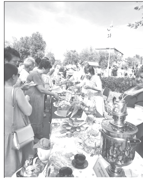
Налетай, народ! Дегустация начинается!