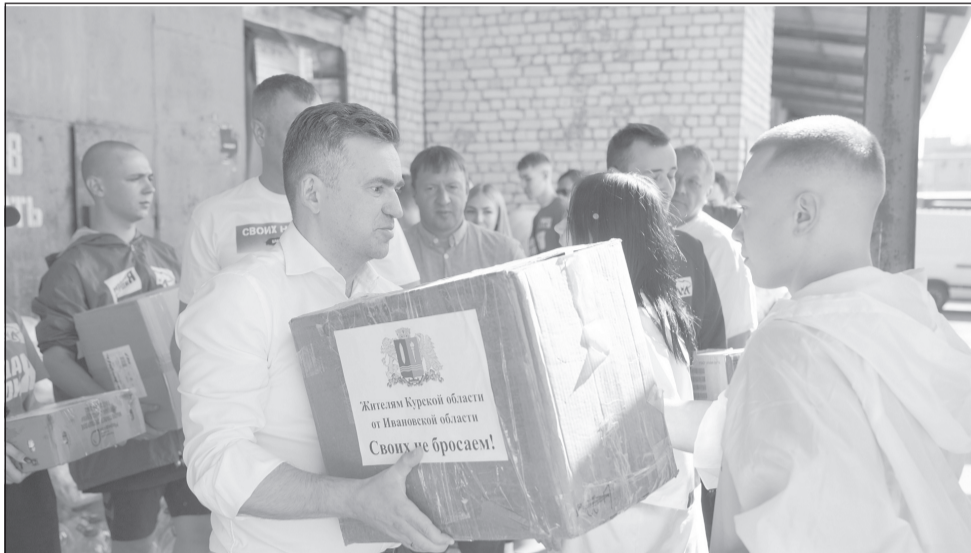
Жители региона отправили очередной груз с гуманитарной помощью в Курскую область.

Более 40 тонн гуманитарной помощи из ивановского региона уже доставили в Курскую область.