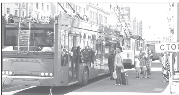
Новые графики движения введены со 2 сентября.

рассказал на встрече со студентами. «Ко мне обращались студенты, молодые люди, у нас, с одной стороны, студенческий город, сам себя помню студентом: в девять спать мы точно не ложились. Но благодаря нашему общественному транспорту студентам приходится либо пешком гулять, либо ложиться спать в девять. Я поручил проработать варианты, какие маршруты в городе могли бы работать до десяти часов вечера, отдельные несколько маршрутов, я считаю, долж-