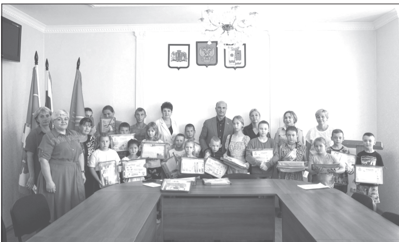
Фото на память не только о начале учебного года, но и о людях, которые делают добрые дела

В преддверии нового 2024-2025 учебного года по инициативе «ЕР» организована акция «Собери ребенка в школу», направленная на оказание помощи в подготовке детей к новому учебному году. Она адресована категории малообеспеченных семей и семей, находящихся в трудной жизненной ситуации.