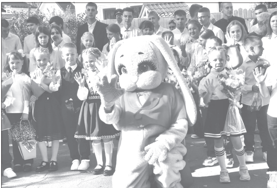
Гвоздь программы - ростовая кукла, придавшая празднику новизну и веселье

сложатся школьные истории первоклашек, как сложится жизнь выпускников после школы? Но в любом случае, они были главными героями торжественной линейки, посвящённой началу учебного года. Она прошла на площадке перед школой, и ребят приветствовали не только педагоги, гости, но и солнышко.