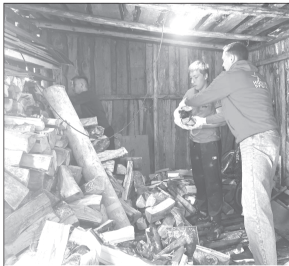
Волонтеры готовы прийти на помощь в любое время

Волонтеры корпуса «Добро» всегда готовы прийти на помощь.