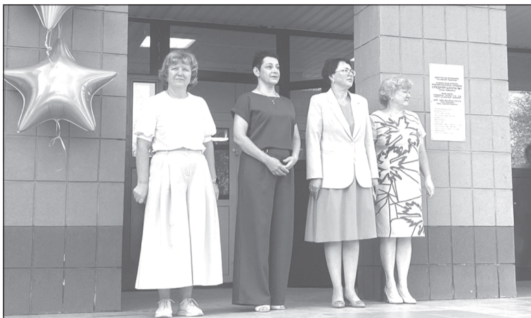
Поздравляя школьников, каждый взрослый вспоминает свой класс и свои школьные годы

Лето задержалось в городе, а вместе с ним и начало учебного года. Школьники, педагоги, родители и почетные гости праздника собрались во дворе школы №1 солнечным утром 2 сентября. Линейка открылась поднятием российского триколора, прозвучал гимн. Лирическую ноту в торжество внес вальс старшеклассников.