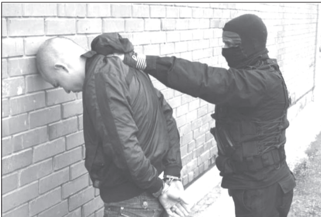
8 лет за решёткой - это справедливо!

Ивановским районным судом осужден наркоторгер, организовавший межрегиональный канал поставки наркотического средства в особо крупном размере.