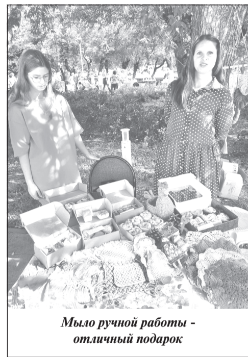
Мыло ручной работы - отличный подарок