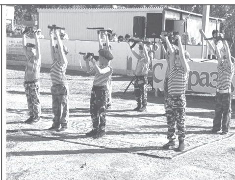
Юные артисты радуют жителей села своими яркими номерами