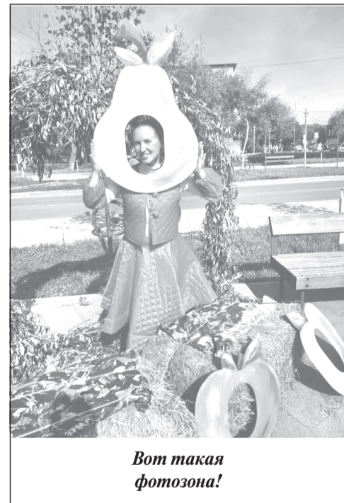
Вот такая фотозона!