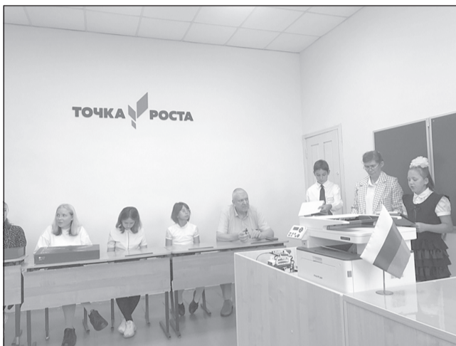
«Точка роста»: красиво, функционально, современно

В октябре Рождественской ОШ исполняется 115 лет! Но подарки школа начала принимать уже сейчас. И первым таким подарком стало открытие в День знаний Центра образования естественно-научного и технологического профилей «Точка роста».