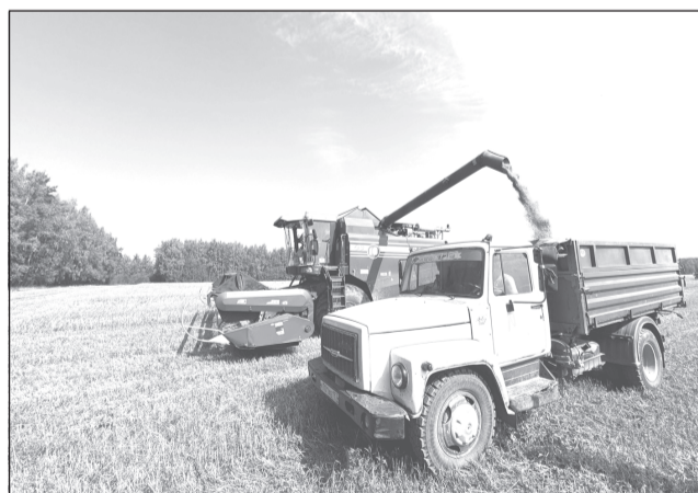
Уборочная кампания набирает обороты

года. Аграрии уже получили свыше 600 млн рублей в виде различных форм господдержки. Темпы доведения субсидий позволяют обеспечить успешное проведение сезонных полевых работ – своевременно закупить ГСМ, семена, удобрения и другую продукцию», – отметил руководитель аграрного ведомства.