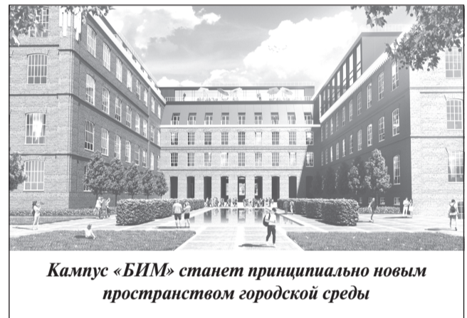
Кампус «БИМ» станет принципиально новым пространством городской среды

«Соглашение позволит реализовать научно-иссле-