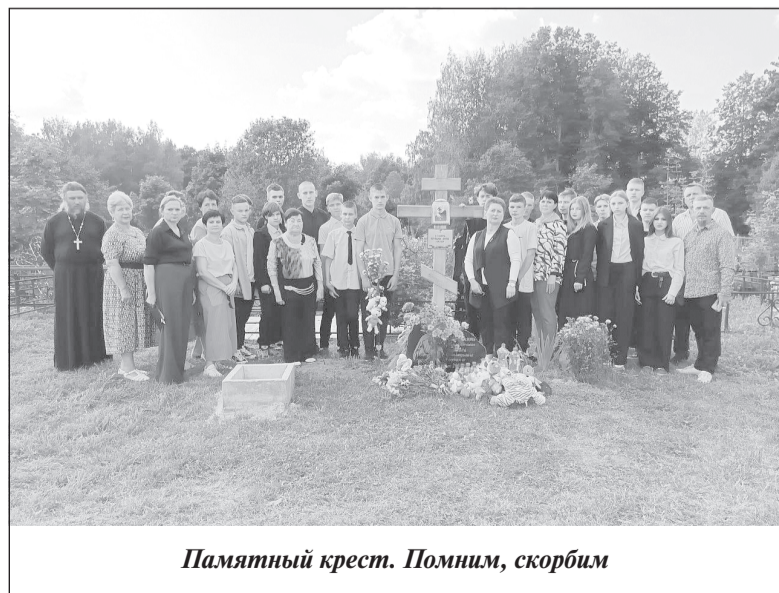
Памятный крест. Помним, скорбим