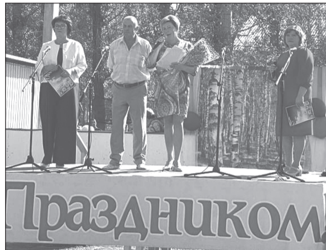
Со сцены звучат поздравления в адрес ингарцев

Как всегда праздник начался с детской программы. В этот раз это были краски Холи и пенное шоу от «Балагана 37», по окончании которой ребята ждали сладкий стол с арбузами и тортами.