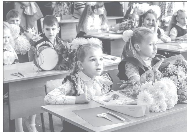
Хотим всё знать!

Первоклассникам вручили традиционные подарки от попечителей школы. Ребята получили наборы канцелярии, а также специальные стикеры с символикой Плёса и фирменные жилетки с логотипом Плесской средней школы.