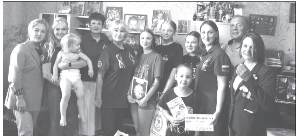
Главное, что приволжане не бросили беженцев в трудную минуту