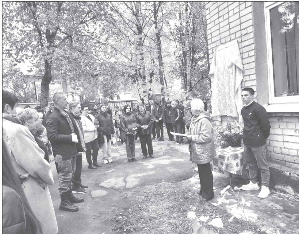
Тяжело говорить о потерях...