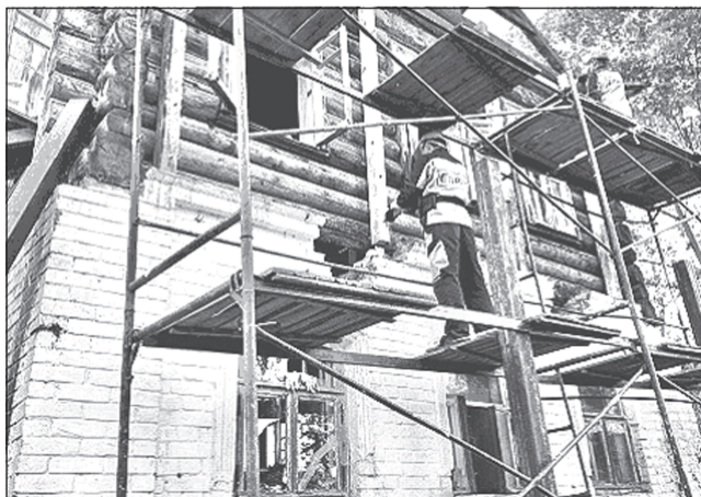
Ювелирная работа реставраторов.

«Устройство фундаментов в таких грунтах под разгрузочные стойки сродни маленькому подвигу», - подчеркивают реставраторы.