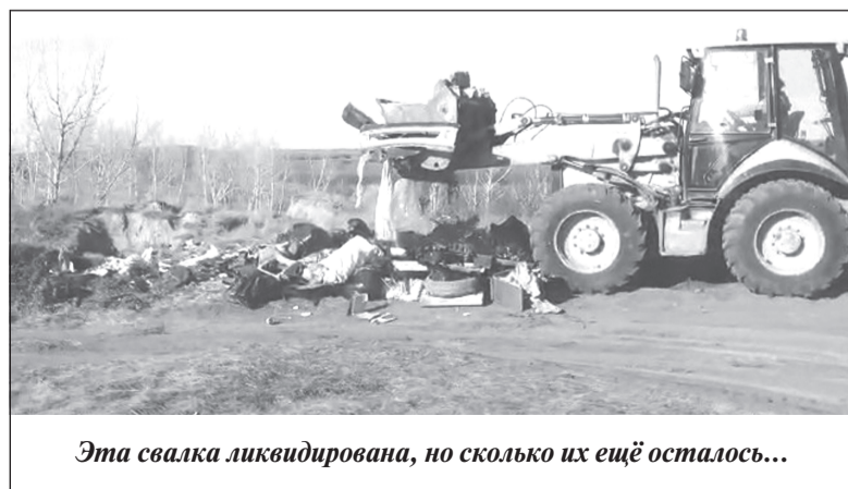
Эта свалка ликвидирована, но сколько их ещё осталось...

Информация по факту складирования отходов направлена в администрацию Ивановского района для рассмотрения и принятия мер в рамках своих полномочий. В августе Управлением проведено повторное контрольное мероприятие на данном участке. Установлено, что данная свалка ликвидирована. Таким образом, благодаря про-