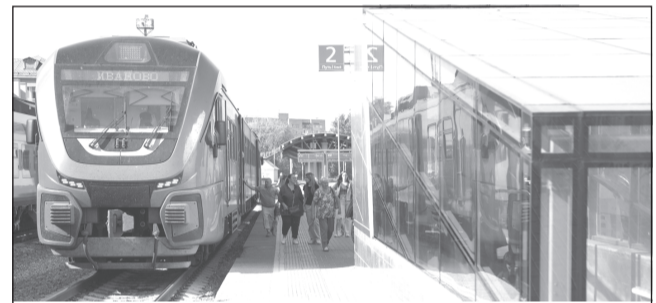
Строительство «наземного метро» в Иваново — дело ближайшего будущего.

На сегодняшний день приступили к благоустройству территорий, прилегающих к станциям в Курьянове, Отрадном, Пустошь Боре и «Красная Талка» на Сортировке. Конtrakтами предусмотрена реконструкция прилегающей к станциям территории: обустройство подъездов и пешеходных зон, создание парковочных мест, благоустройство и озеленение. Сами железнодорожные станции построят силами РЖД.