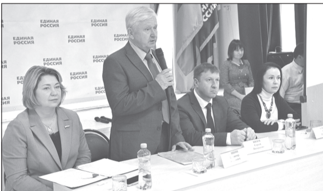
Основное внимание Координационного совета уделено формированию бюджета на 2025 год