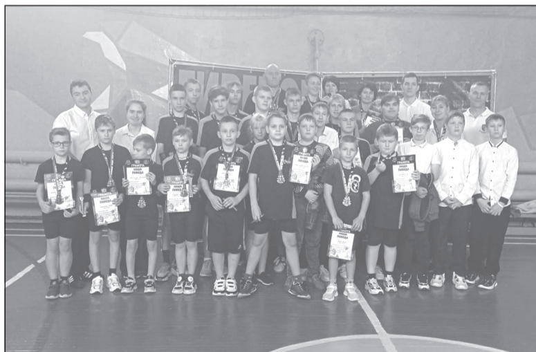
Спортивные традиции продолжаются

В детско-юношеской спортивной школе г. Приволжска прошли соревнования по гиревому спорту, гиревому полумарафону и русскому бицепсу «Наша Победа», посвященные Всероссийскому дню спортсменов силовых видов спорта.