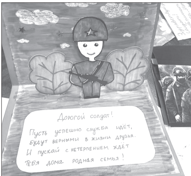
Военные говорят, что их поддерживают такие детские письма