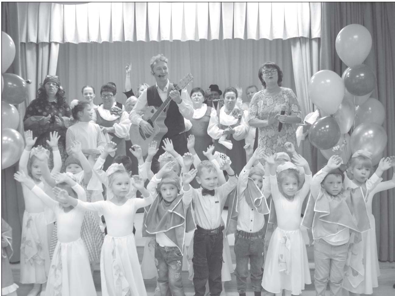
Гостей Ингарь принимал радушно

Праздничное мероприятие состоялось в с. Ингарь в честь открытия площадки «Притяжение» и завершения капитального ремонта административного здания, где наряду с администрацией села располагается местный культурно-досуговый центр.