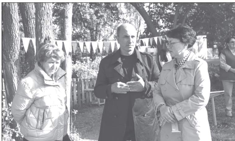
Преображаются и детсады, и территории вокруг них

В детском саду №1 «Сказка» недавно состоялось торжественное открытие новой спортивно-игровой площадки. Мероприятие стало важной вехой в рамках реализуемого в Ивановской области проекта «ЕР» по созданию спортивно-развивающей инфраструктуры в дошкольных учреждениях под названием «Детское пространство 37».