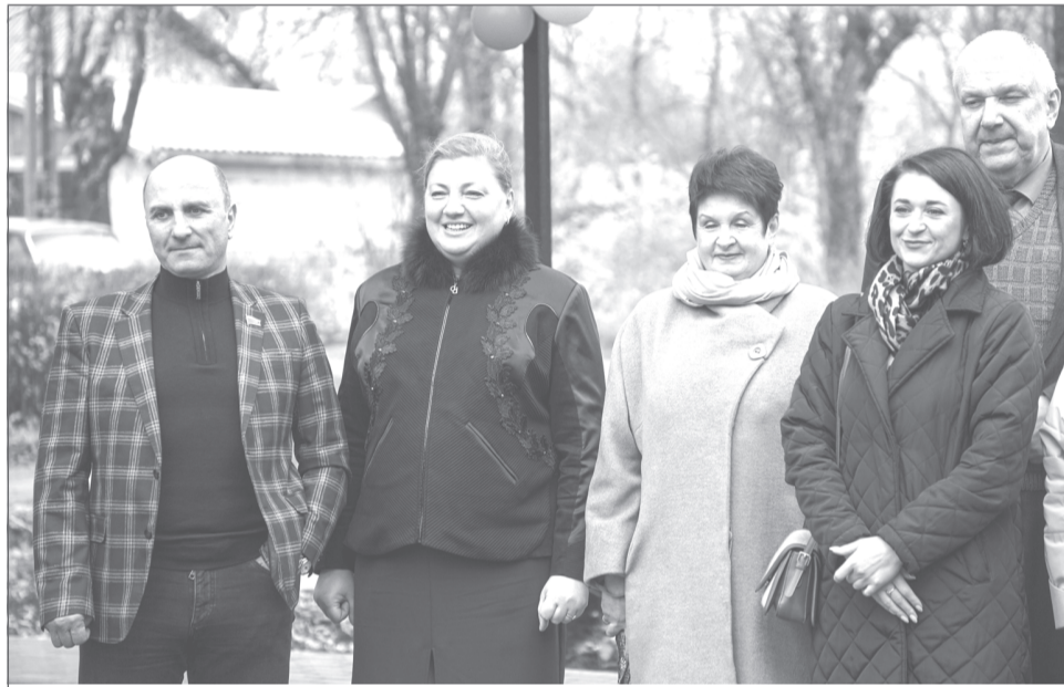
На открытие РКЦ прибыли почётные гости

Концерт по случаю праздника получился теплым, ярким, по-семейному добрым. И это не удивительно — в селе знают друг друга практически все жители. Невозможно было не заметить их сплоченности и общей радости. Старшие ар-