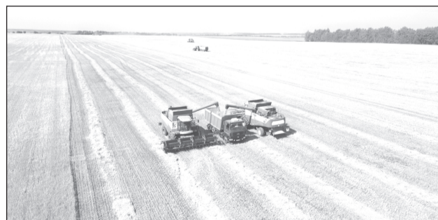
В хозяйствах продолжается уборка овощей и картофеля.

На территории Ивановской области полностью убраны зерновые и зернобобовые культуры, намолочено 132 тыс. тонн зерна в бункерном весе при средней урожайности 22,4 центнера с гектара.