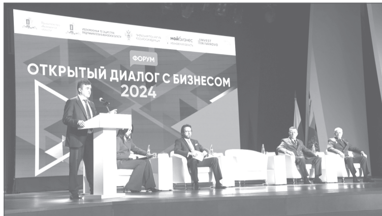
Мы все должны мобилизоваться и работать очень ответственно.

В рамках форума «Открытый диалог с бизнесом», где обсуждали вопросы взаимодействия власти и предпринимательского сообщества, затронули вопросы реализации национальных проектов и важных социальных и инфраструктурных программ.