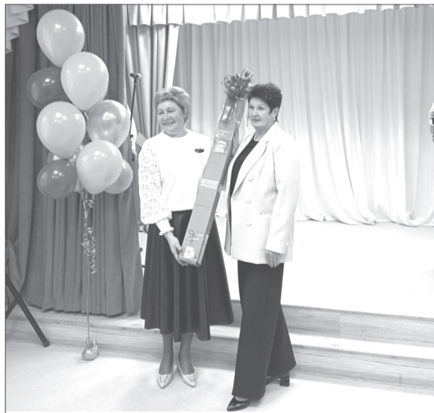
В праздничный день ингарцы получили множество подарков